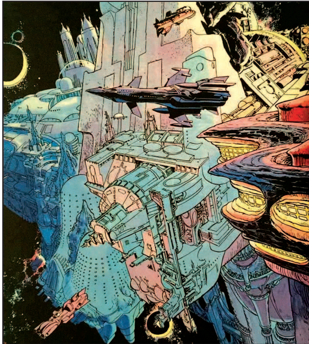
Наверху: Вид изнутри (слева) и снаружи (справа) Главного Пункта, вдохновившего на создание Альфы, из комикса «Посланник Теней». Рисунки Жан-Клода Мезьера Внизу: Группа основных инопланетян фильма (слева направо): Сиирт-полицейский и концепт-арты Сиирта Патриса Гарсии; Игон Сирасс; Игон Сирасс Джуниор, Ходар'Кхан, Мегатор и Пит-Гхор (концепт-арты Бена Мауро); Валериан в полный рост; К-Трон, Император Жемчужин Хабан-Лимай (концепт-арты Бена Мауро); Доган Дагуис, Да и мама Да (концепт-арты Патриса Гарсии); Дубликатор с Мюля (концепт-арт Жан-Клода Мезьера); Булан-Батор III, жена Булан-Батора, сын Булан-Батора, Мартапурай (концепт-арты Патриса Гарсии); Аспан (концепт-арт Бена Мауро); глава государства № 9 (концепт-арт Патриса Гарсии); Кортан Даук, Пальм-Муре (концепт-арты Бена Мауро); Посол Меркурия, Зеркальный, Арисум-Кормн, КСО2 (концепт-арты Патриса Гарсии)