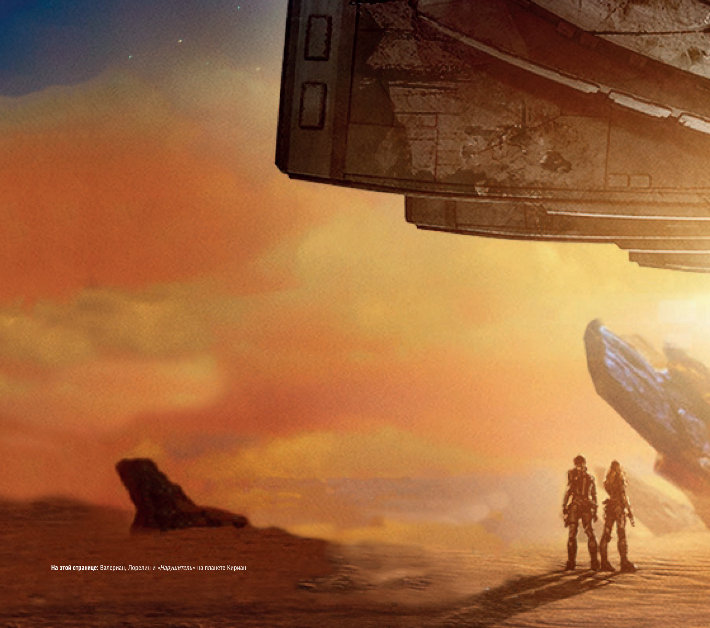
На этой странице: Валериан, Лорелин и «Нарушитель» на планете Кириан