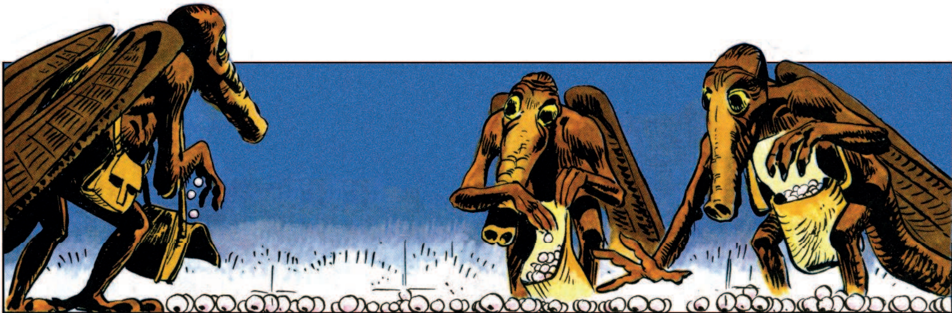
Выше: Шингоуз (в фильме названный Доган Дагуис ) получает деньги за найденную им информацию. Рисунок Жан-Клода Мезьера из «Посланника Теней»

зданной Мезьером. Мне следовало придерживаться определенных правил, рисовать в том же ключе, в котором сделаны комиксы о Валериане, и при этом делать их реалистичными. Мир Валериана чуточку старомоден, но он прямо-таки пестрит бесценными деталями, поэтому нам нужно было кое-что сохранить для будущего фильма».