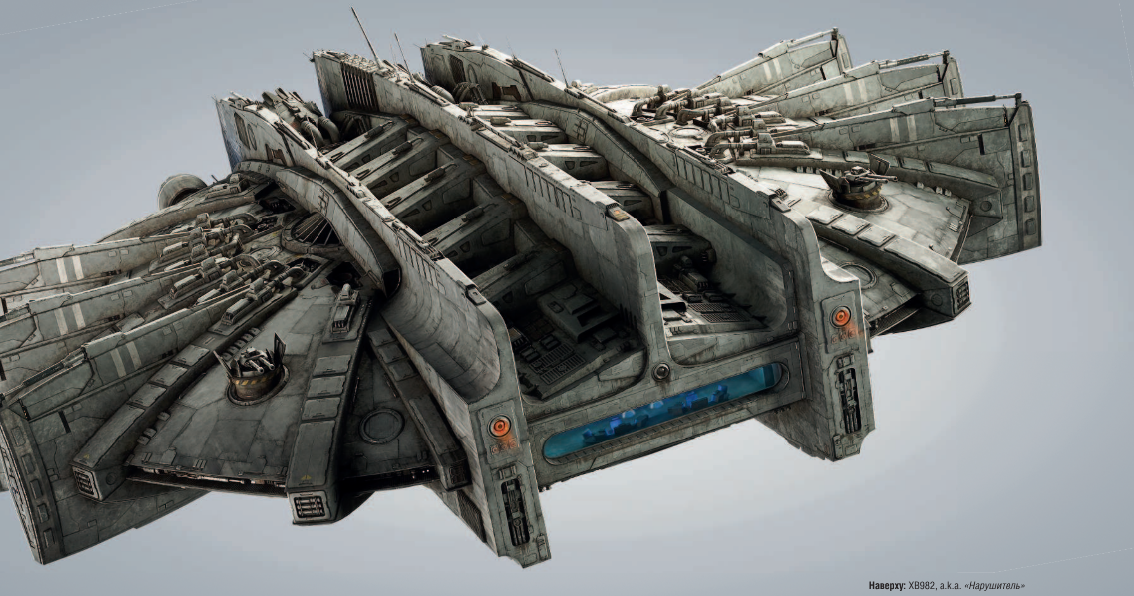
Наверху: XB982, а.к.а. «Нарушитель»

Слева: Валериан (Дэйн ДеХаан) в космическом скафандре