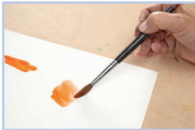
Правильно: горизонтально держать кисточку за среднюю часть ручки.