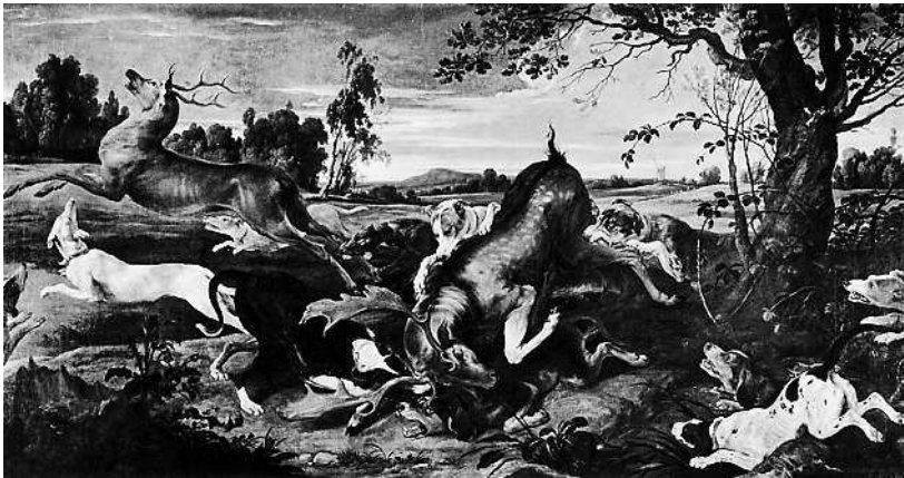
Франс Снейдерс. Оленья охота.

совали его младшие братья — Одон и в особенности Шарль, который проявлял большую склонность к искусству. «Когда мои мальчики подстреливают вальдшнепа, — говаривала бабушка Габриэль, — они получают тройное удовольствие: от удачной охоты, от натюрморта и от жаркого».