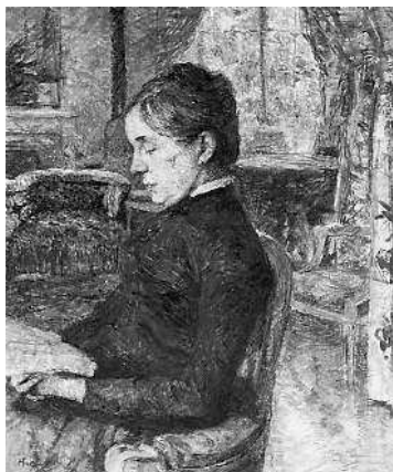
Портрет графини Адели де Тулуз-Лотрек.

Так пусть же Бог даст сына, который станет истинным Тулуз-Лотреком: он будет жить, отрешенный от этого недо-