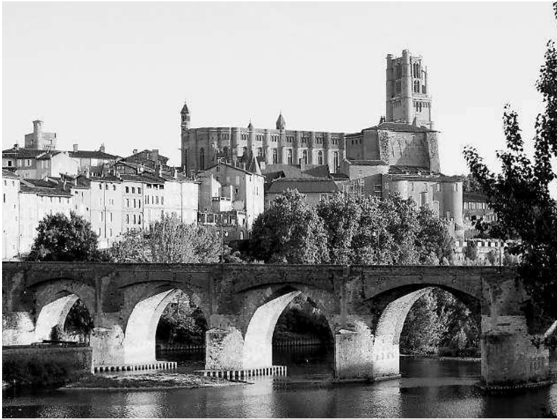
Старинный город Альби во Франции.

ны были стать бабушками, свекор, Черный Принц, суровый властелин, обосновавшийся в своем родовом замке Боск, где он был истинным автократом, и, конечно, муж графини Адели, граф Альфонс, который всегда жил несбыточными мечтами и теперь уже заранее представлял себе то время — и чем раньше оно настанет, тем лучше! — когда сын будет сопровождать его на соколиную охоту и в прогулках верхом по графским угодьям.