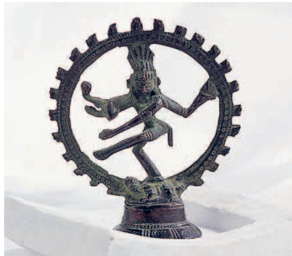
Вверху. Шива, один из богов индуистской триады, изображен в воплощении Натараджи — короля танца. Круг огня символизирует вечное движение обращаемой Вселенной

Прана — жизненная энергия, заключенная в дыхании, поэтому это слово можно также перевести как «дыхание жизни». Аяма значит «расширение» или «растягивание», а значит, пранаяма — это практика, во время которой жизненная энергия увеличивается за счет управления дыханием и контроля над ним. Естественный звук вдоха сохам ( сох-хам ), на санскрите означающий «Я есть... вне пределов возможностей тела и ума», с каждым вдохом невольно резонирует по всему телу как мантра (священная молитва). В йоге считается, что, вслушиваясь в каждый вдох, мы слышим и эту тихую молитву.