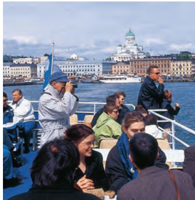
На одном из популярных туристических паромов в Хельсинки

Будьте внимательны, если увидите предупреждающие знаки о возможности появления диких животных! На дорогу, особенно в сумерки, часто выходят лоси и северные олени. При столкновении с животным необходимо сразу сообщить о произошедшем в полицию по единому номеру 112 (действует также и для службы спасения).