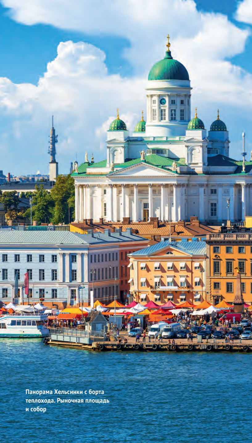
Панорама Хельсинки с борта теплохода. Рыночная площадь и собор