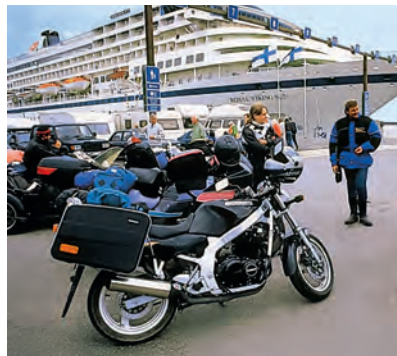
Путешествие с полным комфортом: круизы по Балтийскому морю на современных паромах

Интереснее всего в Финляндию ехать по магистральным дорогам европейского стандарта Via Baltica. Автомобильный маршрут в комбинации с паромом проходит через Гродно в Белоруссии, Вильнюс, Ригу и Таллин. Оттуда ежедневно отправляются пассажирские и автомобильные паромы в Хельсинки (например, Tallink Silja Line и Viking Line). Из Санкт-Петербурга можно доехать до финско-российских