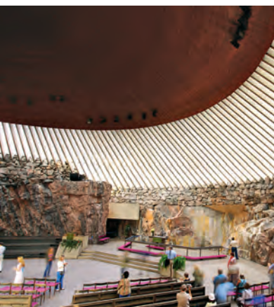
Скальная церковь, вид изнутри