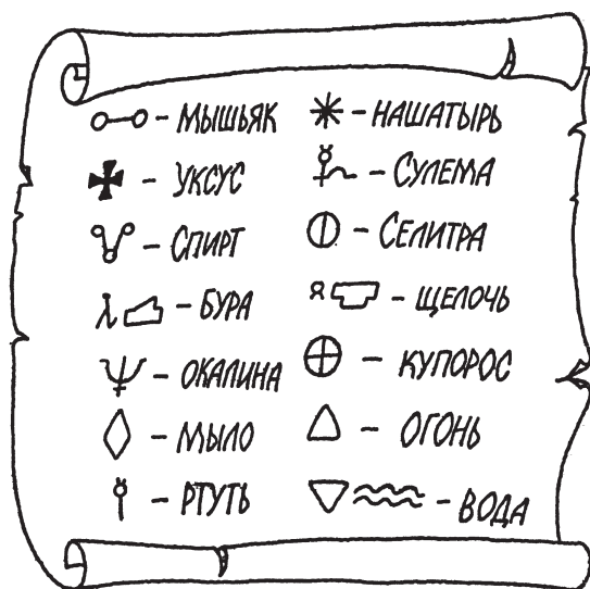
Условные знаки алхимиков

Среди древних алхимических рецептов можно найти описание оригинальных методов получения тех или иных веществ — например, дисульфида олова. Это кристаллическое вещество, напоминающее ЗОЛОТО , а поэтому и называвшееся в старину сусальным , часто применяли вместо позолоты. Сегодня сусальным золотом называют также тончайшее листовое золото. Алхимики Европы получали \text{SnS}_2 из амальгамы олова, серы и хлорида алюминия. В XVIII веке было установлено, что ртуть для этого синтеза необязательна.