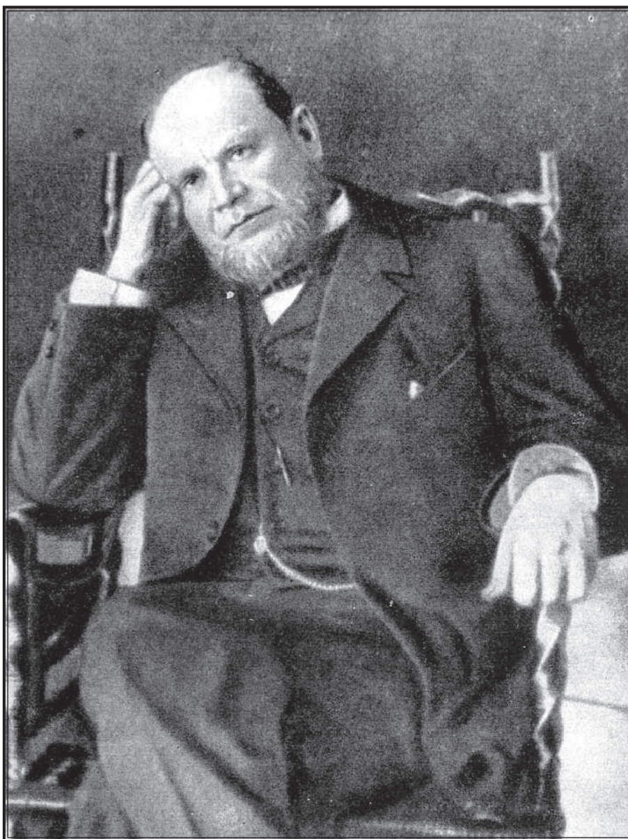
А. Ф. Кони (1844—1927).