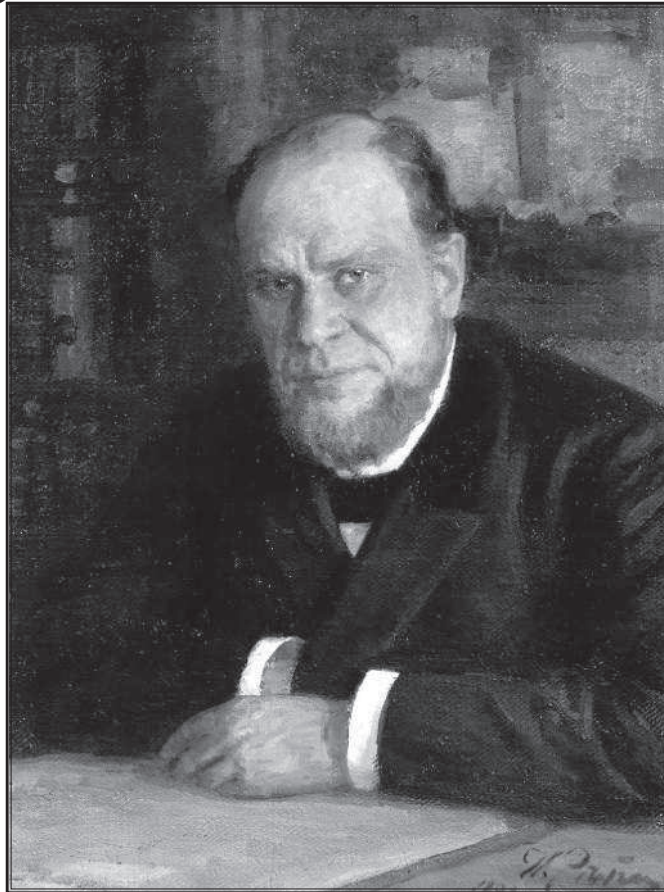
И. Е. Репин. Портрет А. Ф. Кони. 1898 г.

вызванными, как правило, устранением некоторых повторений фактического материала.