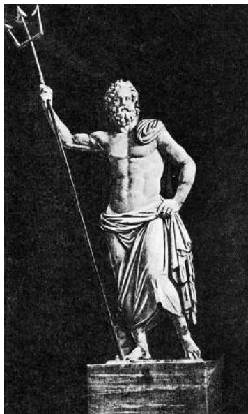
Посейдон (Статуя II в. до н. э.)

слушны малейшему движению его руки, вооруженной грозным трезубцем. Там, в глубине моря, живет с Посейдоном и его прекрасная супруга Амфитрита, дочь морского вещего старца Нерея, которую похитил Посейдон у ее отца. Он увидел однажды, как водила она хоровод со своими сестрами-нереидами на берегу острова Наксос. Пленился бог моря прекрасной Амфитритой и хотел увезти ее на своей колеснице. Но Амфитрита укрылась у титана Атласа, который держит на своих могучих плечах небесный свод. Долго не мог Посейдон найти прекрасную дочь Нерея. Наконец открыл ему ее убежище дельфин; за эту услугу Посейдон поместил дельфина в число небесных созвездий. Посейдон похитил у Атласа прекрасную дочь Нерея и женился на ней.