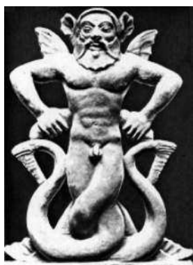
Тифон (Терракота, VI в. до н. э.)

Но не окончилась этим борьба. Гея-Земля разгневалась на олимпийца Зевса за то, что он так сурово поступил с ее побежденными детьми-титанами. Она вступила в брак с мрачным Тартаром и произвела на свет ужасное стоголовое чудовище Тифона. Громадный, с сотней драконовых голов, поднялся Тифон из недр земли. Диким воем всколебал он воздух. Лай собак, человеческие голоса, рев разъяренного быка, рыканье льва слышались в этом вое. Бурное пламя клубилось вокруг Тифона, и земля колебалась под его тяжелыми шагами. Боги содрогнулись от ужаса. Но смело ринулся на Тифона Зевс-громовержец, и начался бой. Опять засверкали молнии в руках Зевса, раздались раскаты грома. Земля и небесный свод со-