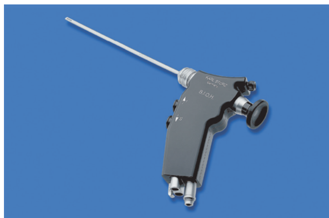
Рис. 2. ВІОН: интегрированный офисный гистероскоп с 2-мм стержневой системой линз с подачей и оттоком жидкости и возможностью подсоединения источника света (внизу)