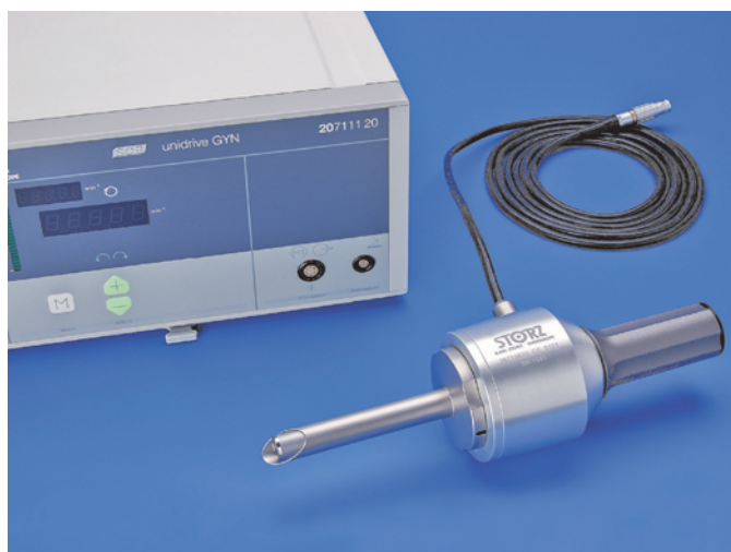
Рис. 1. Морцеллятор Rotocut G1: эргономичный и мощный морцеллятор для быстрого удаления миоматозных узлов или ткани матки поле энуклеации миоматозных узлов или гистерэктомии

В настоящее время наблюдается четкая тенденция к повышению стоимости эндоскопической аппаратуры. Например, применение одноразового инструментария с многих точек зрения более