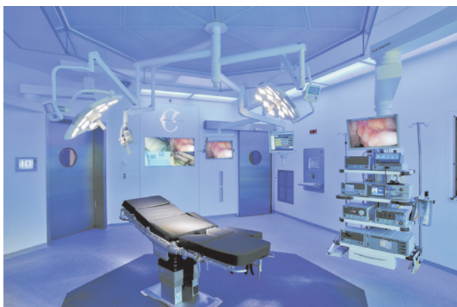
Рис. 3. OR1: интегрированная операционная аппаратура высокого разрешения

безопасно, но увеличивает стоимость процедуры. Развитие медицины привело к созданию комплексной роботизированной хирургии — роботу «Да Винчи» (рис. 4). Систему «Да Винчи» довольно сложно освоить [7], но она значительно упрощает выполнение сложных процедур путем повышения точности манипуляций. Кроме того, применение роботизированной техники позволяет хирургу проводить оперативные вмешательства дистанционно, находясь не в операционной и даже без предварительной обработки рук. Безусловно, да-