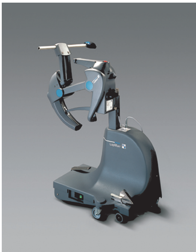
Рис. 5. Лэпмэн: динамический держатель лапароскопа

Другой инновацией интраперитонеальной хирургии является аппарат под названием ЛапароТензер®, представляющий собой подкожное устройство для элевации передней брюшной стенки и применяемый в безгазовой лапароскопии [8]. Безгазовая лапароскопия была разработана как способ нивелирования рисков, характерных для слепого введения иглы для инсуффляции газа и влияния пневмоперитонеума на сердечную и дыхательные системы [9]. Одновременно при безгазовой лапароскопии можно использовать и лапароскопические, и традиционные хирургические инструменты [8]. Используемое ранее оборудование было громоздко и представляло собой 3 лопасти, размещенные в брюшной полости. При введении в брюшную полость лопасти были плотно связаны между собой, а потом раскрывались, образуя треугольник; в этой конфигурации они и обеспечивали элевацию передней брюшной стенки. К сожалению, подобные инструменты не обеспечивали должного обзора операционного поля. При использовании ЛапароТензера две изогнутые иглы большого диаметра с тупыми концами вводятся в подкожно-жировую клетчатку через разрезы кожи размером 2 мм по одному в каждом