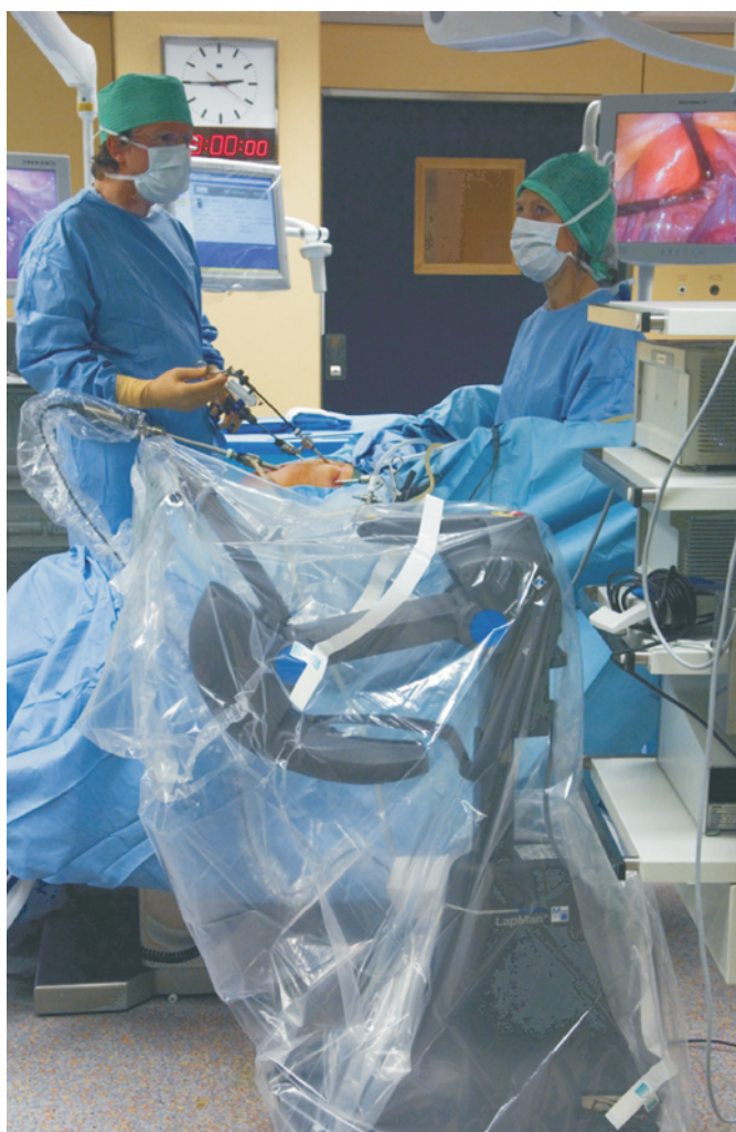
Рис. 6. Использование Лэпмэна в работе

Другой инновацией интраперитонеальной хирургии является аппарат под названием ЛапароТензер®, представляющий собой подкожное устройство для элевации передней брюшной стенки и применяемый в безгазовой лапароскопии [8]. Безгазовая лапароскопия была разработана как способ нивелирования рисков, характерных для слепого введения иглы для инсуффляции газа и влияния пневмоперитонеума на сердечную и дыхательные системы [9]. Одновременно при безгазовой лапароскопии можно использовать и лапароскопические, и традиционные хирургические инструменты [8]. Используемое ранее оборудование было громоздко и представляло собой 3 лопасти, размещенные в брюшной полости. При введении в брюшную полость лопасти были плотно связаны между собой, а потом раскрывались, образуя треугольник; в этой конфигурации они и обеспечивали элевацию передней брюшной стенки. К сожалению, подобные инструменты не обеспечивали должного обзора операционного поля. При использовании ЛапароТензера две изогнутые иглы большого диаметра с тупыми концами вводятся в подкожно-жировую клетчатку через разрезы кожи размером 2 мм по одному в каждом