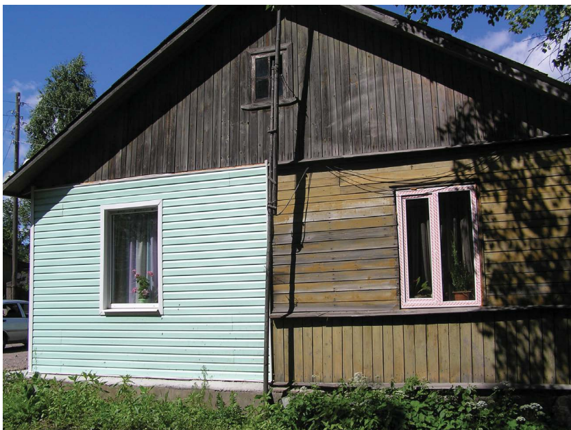
Рис. 1.1. Контраст двух разных видов одного дома – в процессе работы

Это справедливо для внешних стен дома. Но что прикажете сделать в первых (с улицы) помещениях, то есть прихожей вплоть до гостиной, – так ведь тоже надо создать уют, в продолжение хорошего впечатления, которое сложилось еще за порогом.