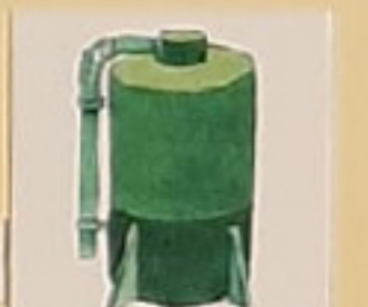
БУНКЕР ДЛЯ ЗЕРНА