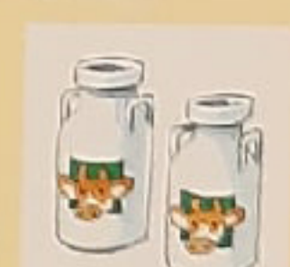
ВИДОНЫ С МОЛОКОМ