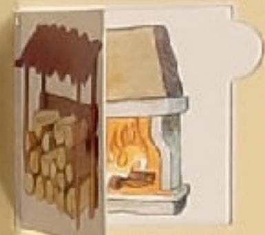
САРАИ ДЛЯ ДРОВ