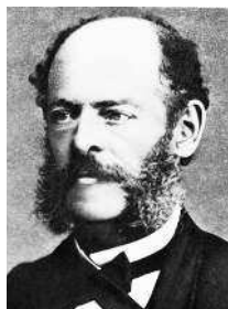
Марселино Санс де Саутуола

Сейчас мало кто сомневается в том, что первые люди умели рисовать.