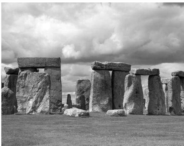
Кромлех Стоунхендж. Англия. Эпоха бронзы