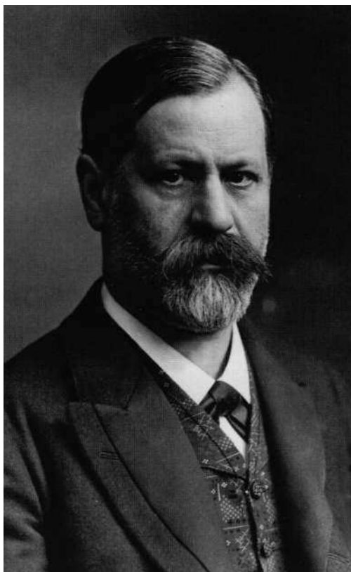
Зигмунд Фрейд 1856–1939