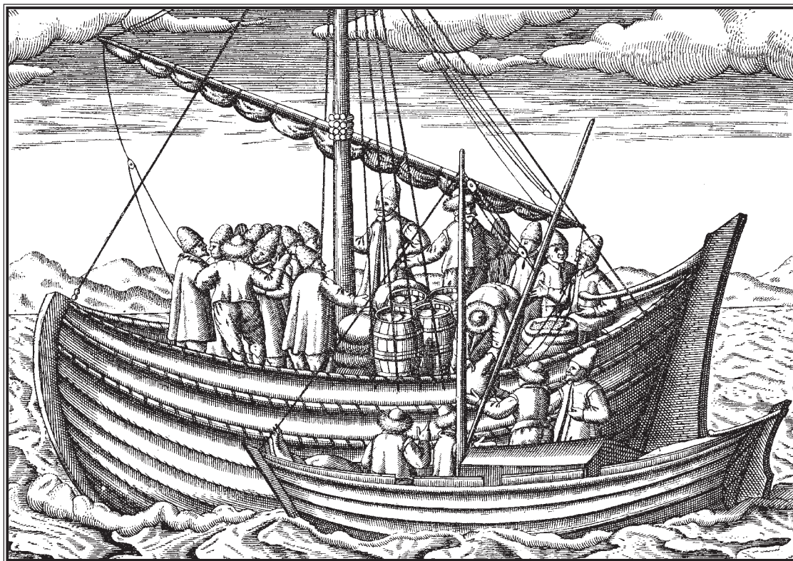
Русский корабль в Ледовитом океане.

Позднее же, при вторичной просьбе Иоанна об оказании ему помощи флотом в борьбе за Ливонию, переговоры были оставлены из-за бестактности английского посла, усомнившегося в справедливости русских притязаний на Ливонию, которую Грозный назвал «нашею вотчиной». Послу пришлось выслушать от разгневанного царя полный достоинства ответ: «Мы не просим королеву быть судьей между Нами и королем Польши». И переговоры о флоте прервались.