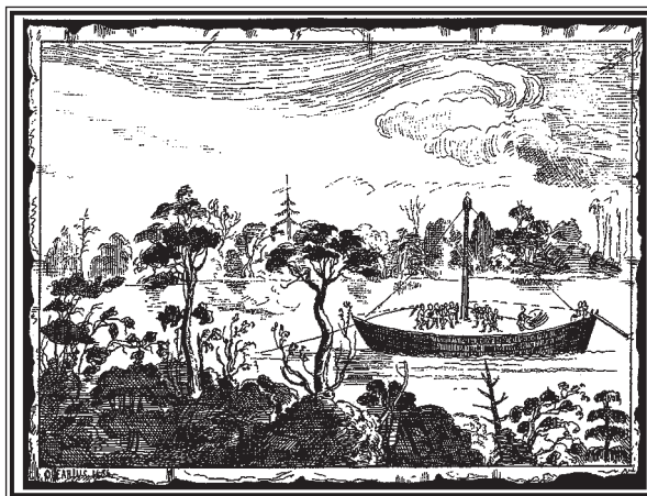
Способ передвижения по рекам с помощью бечевы, которую тянут по берегу (волоком).

Уничтожив с покорением Новгорода участие новгородцев в Ганзейском союзе, Иоанн для того же Ганзейского союза открыл Нарву и разными льготами привлек в нее, кроме ганзейских, торговые суда английские, французские, норвежские, итальянские, голландские. Через Нарву в Россию хлынула волна новых товаров, нового просвещения и новых идей. Встревоженный возрастающим значением Московского царства, польский король Сигизмунд Август писал в Англию королеве Елизавете: