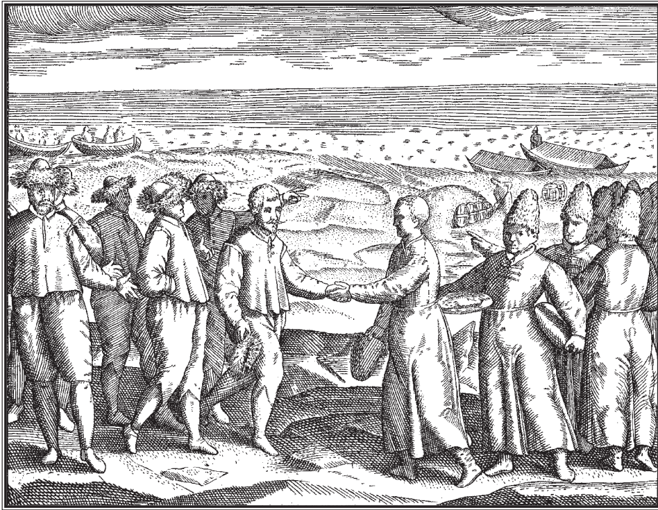
Встреча голландских моряков с русскими на севере России.

Гравюра к изданию книги голландского мореплавателя Геррита де Веера «Правдивое описание трех морских путешествий на голландских и зеландских кораблях, к северу от Норвегии, Московии и Татарию, в королевства Китай и Хину». 1598 г.