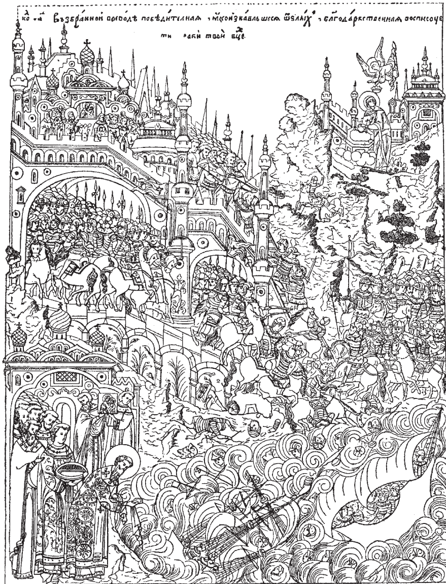
Русский флот перед Константинополем в 866 г. Прорисовка русской иконы XVII в.

Пятый поход. После неудачного похода 941 г. князь Игорь неустанно собирал силы для нового нападения на Византию. К новому морскому походу были призваны, кроме русских, варяги и печенеги.