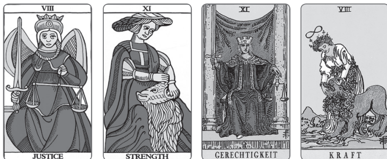
Традиционная нумерация в Марсельском Таро