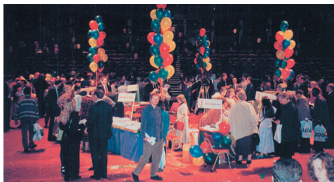
Рисунок 1. Фестиваль мышления в королевском Альберт-холле в Лондоне (1995) в честь совершеннолетия книги «Научите себя думать»