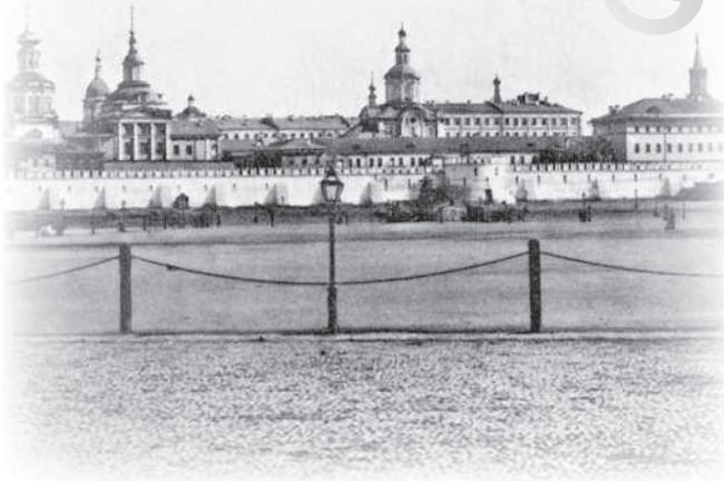
Китай-город. Вид с Театральной площади

Против Проломных ворот десятки ломовиков то сидели идолами на своих полках, то вдруг, будто по команде, бросались и окружали какого-нибудь нанимателя, явившегося за подводой. Кричали, ругались. Наконец по общему соглашению устанавливалась цена, хотя нанимали одного извозчика и в один конец. Но для нанимателя дело еще не было кончено, и он не мог взять возчика, который брал подходящую цену. Все ломовые собирались в круг, и в чью-нибудь шапку каждый бросал медную копейку, как-нибудь меченную. Наниматель вынимал на чье-то «счастье» монету и с обладателем ее уезжал.