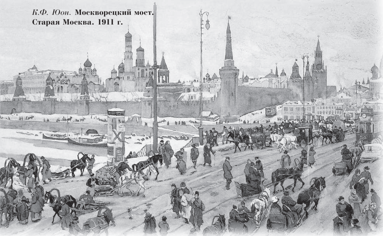
К.Ф. Юон. Москворецкий мост. Старая Москва. 1911 г.

И вдруг — сначала в одном дворе, а потом и в соседних ему ответили проснувшиеся петухи. Удивленные несвоевременным пением петухов, сначала испуганно, а потом зло залились собаки.