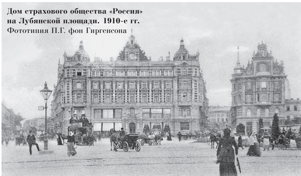
Дом страхового общества «Россия» на Лубянской площади. 1910-е гг.

У Ильинских ворот он указал на широкую площадь. На ней стояли десятки линейек с облезлыми крупными лошадьми. Оборванные кучера и хозяева линейек суетились. Кто торговался с нанимателями, кто усаживал пассажиров: в Останкино, за Крестовскую заставу, в Петровский парк, куда линейки совершали правильные рейсы. Одну линейку занимал синодальный хор, певчие переругивались басами и дискантами на всю площадь.