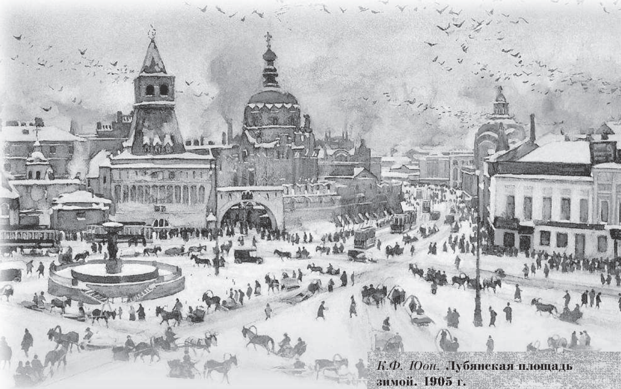
К.Ф. Юон. Лубянская площадь зимой. 1905 г.