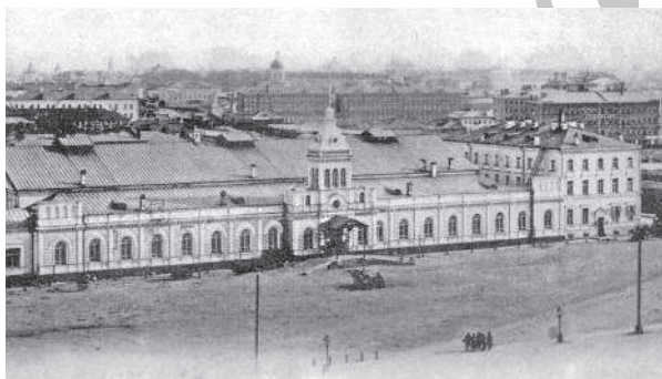
Рязанский вокзал. 1903 г. Издание фирмы «Шерер, Набгольд и К°». (На месте этого здания было построено новое ныне существующее здание Казанского вокзала)

Ольховцы ожили. Кое-где засветились окна, кое-где во дворах застучали засовы, захлопали двери, послышались удивленные голоса: «Что за диво! В два часа ночи поют петухи!»