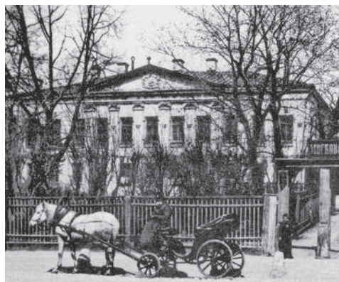
Уездная земская управа на Садовой- Сухаревской. Начало XX в.