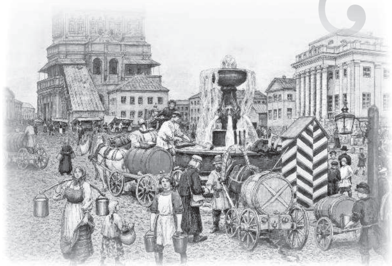
А.М. Васнецов. У водоразборного фонтана на Большой Сухаревской площади в 70-х годах XIX века

пажей допотопного вида, в которых провожали покойников. Там же стояло несколько более приличных карет; баре и дельцы, не имевшие собственных выездов, нанимали их для визитов. Вдоль всего тротуара — от Мясницкой до Лубянки, против Гусенковского извозничьего трактира, стояли сплошь — мордами на площадь, а экипажами к тротуарам — запряжки легковых извозчиков. На морды лошадей были надеты торбы или висели на оглобле веревочные мешки, из которых торчало сено. Лошади кормились, пока их хозяева пили чай. Тысячи воробьев и голубей, шныряя безбоязненно под ногами, подбирали овес.