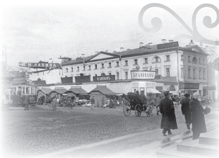
Охотный ряд в сторону Монетного двора. 1910—1912 гг.

Пока мой извозчик добивался ведра в очереди, я на все успел насмотреться, поражаясь суете, шуму и беспорядочности этой самой тогда проезжей площади Москвы... Кстати сказать, и самой зловонной от стоянки лошадей.