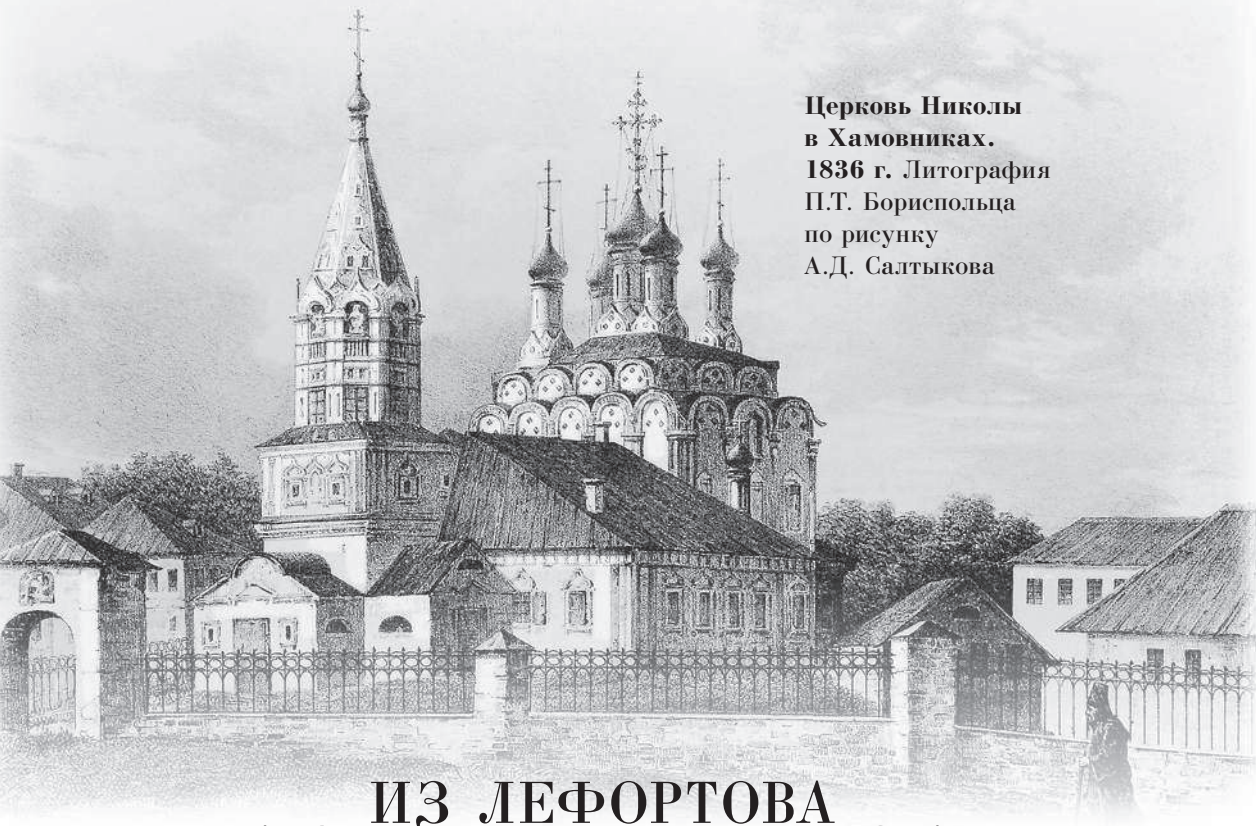
Церковь Николая в Хамовниках. 1836 г. Литография П.Т. Бориспольца по рисунку А.Д. Салтыкова