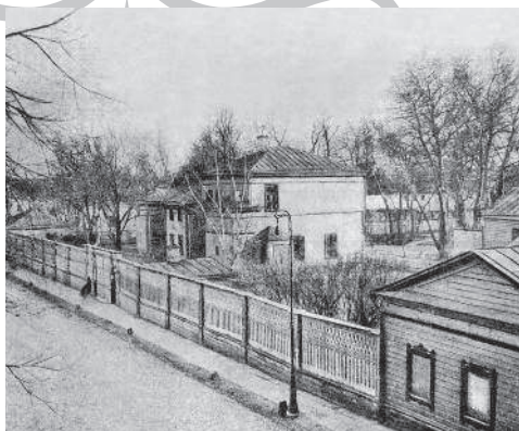
Дом-усадьба Л.Н. Толстого в Большом Хамовническом переулке