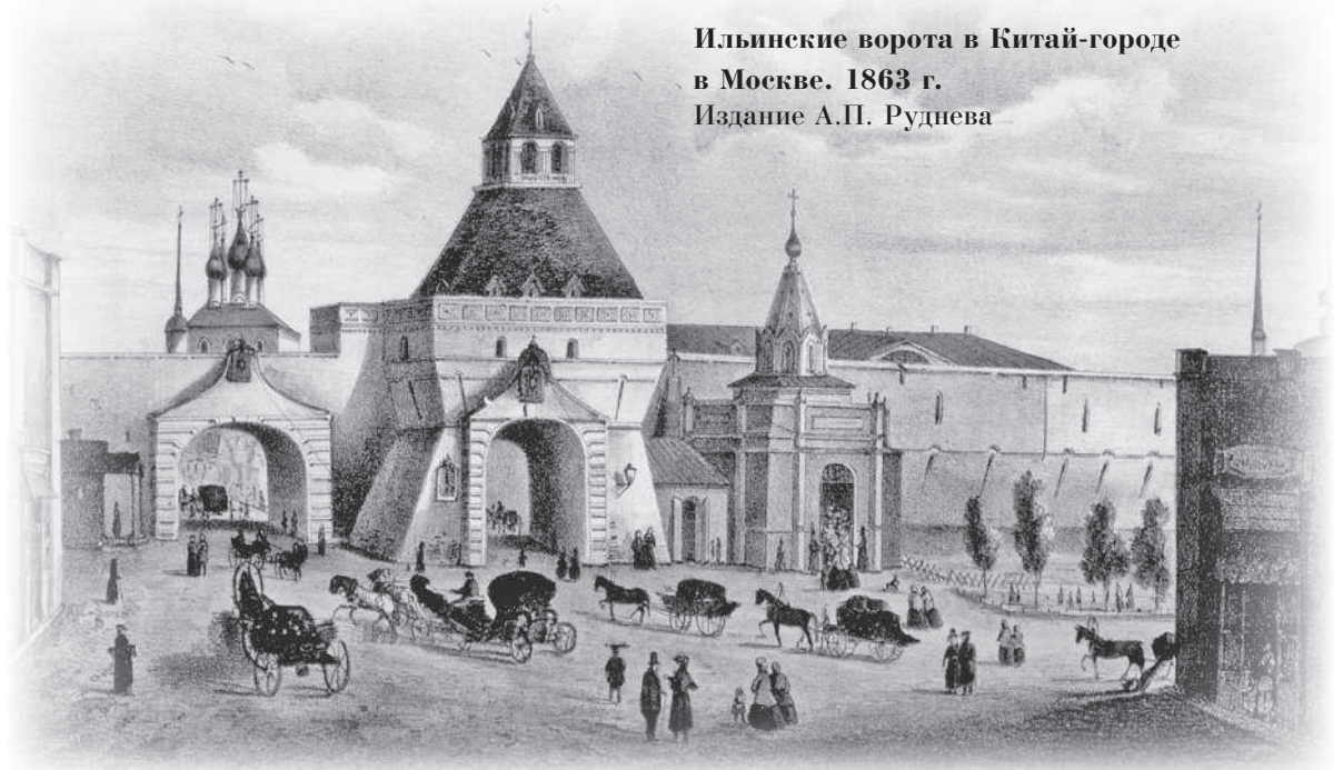
Ильинские ворота в Китай-городе в Москве. 1863 г. Издание А.П. Руднева

Лубянская площадь — один из центров города. Против дома Мосолова (на углу Большой Лубянки) была биржа наемных эки-