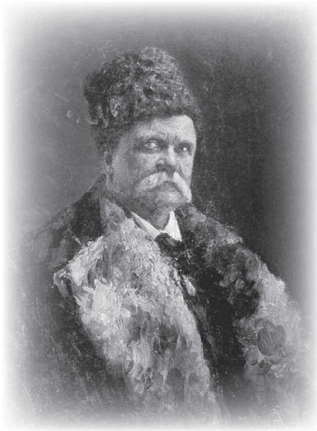
В.Н. Пчелин. Портрет В.А. Гиляровского. 1915 г.