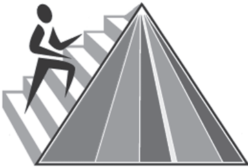
Рис. 1. «MyPyramid». В 2005 году министерство сельского хозяйства США предложило красочную, но лишенную сколько-нибудь полезной информации пирамиду вместо знакомой всем нам старой.

каждой из них. Судя по основанию, нас призывали загружать организм рафинированными крахмалами, а венчала пирамиду категория продуктов «для умеренного потребления», включавшая животные и растительные жиры и сладости. Между основанием и верхушкой располагались фрукты, овощи, белковые и молочные продукты. В течение последующих тринадцати лет проводимые в различных странах мира исследования опровергли предложенную пищевую пирамиду по всем статьям. Результаты десятков крупных исследований значительно урезали ее основание (углеводы), середину (мясо и молоко) и верхушку (жиры). Министерство сельского хозяйства не стало обновлять пирамиду, а просто позволило ей рухнуть под тяжестью новейших научных доказательств.