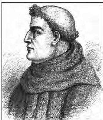
Рис. 1.1. Роджер Бэкон