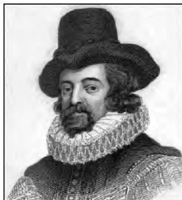
Рис. 1.2. Фрэнсис Бэкон

у мухи 8 лап; если жениться рано, то дети будут женского пола. Проверить эти перлы схоластической мысли в Европе никто так и не удосужился.