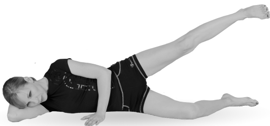
Упр. 5а. Выполнение упражнения. Поднимание ноги

А. Поднимите выпрямленную левую ногу и удерживайте ее на весу под углом примерно 45^\circ около 30 секунд (упр. 5а). После чего медленно опустите ногу и полностью расслабьтесь. Затем перевернитесь на другой бок и повторите упражнение правой ногой . В таком статическом варианте выполните упражнение каждой ногой только по 1 разу.