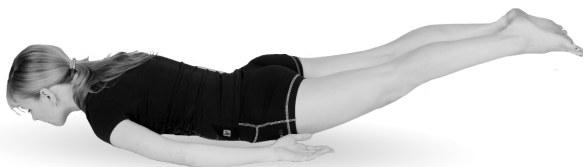
Упр. 4а. Выполнение упражнения. Поднимание ног

Б. Удерживая ноги на весу, плавно разведите их в стороны (упр. 4б). Затем медленно сведите ноги вместе. Не опуская ног, опять медленно разведите их в стороны, после чего вновь медленно сведите их вместе. Выполните 8—10 таких медленных сведений—разведений ног.