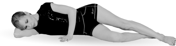
Упр. 5. Исходное положение

А. Поднимите выпрямленную левую ногу и удерживайте ее на весу под углом примерно 45^\circ около 30 секунд (упр. 5а). После чего медленно опустите ногу и полностью расслабьтесь. Затем перевернитесь на другой бок и повторите упражнение правой ногой . В таком статическом варианте выполните упражнение каждой ногой только по 1 разу.