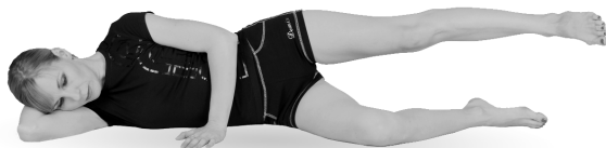
Упр. 5б. Выполнение упражнения. Опускание ноги

Б. После короткого отдыха выполните это же упражнение в динамическом варианте : вновь лежа на правом боку, очень медленно и плавно поднимите вверх левую ногу, выпрямленную в колене, и задержите ее в верхней точке на 1—2 секунды. Затем медленно и плавно опустите ногу на 10—20 см вниз (упр. 5б).