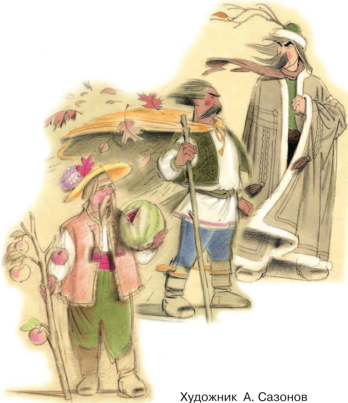
Художник А. Сазонов