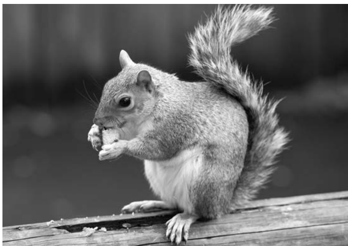
Белка инстинктивно знает, когда следует прекратить есть.

Я невольно задумался: почему белка предпочла приберечь орехи на будущее, а не съесть их тут же?