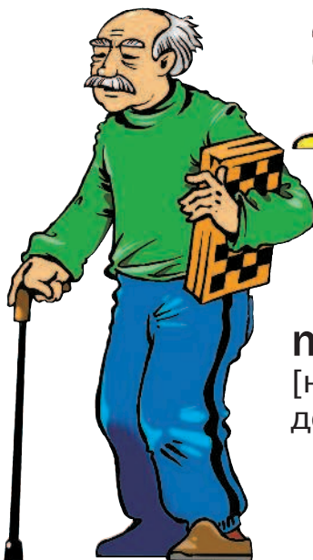
nonno m [нонно] дедушка