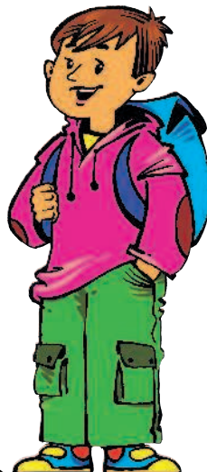
fratello m [фратэлло] брат