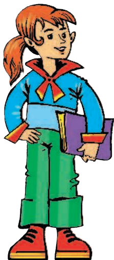
sorella f [сорэлла] сестра