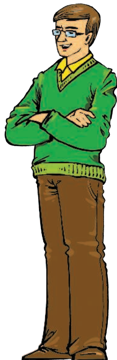
padre m [падрэ] отец