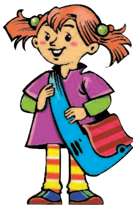
daughter [ДО:ТЭ] дочь