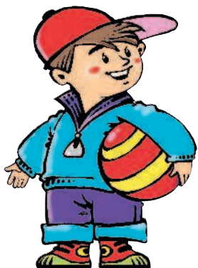
son [САН] сын