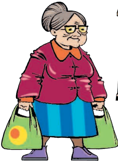
grandmother [ГРЭНМАЗЭ] бабушка