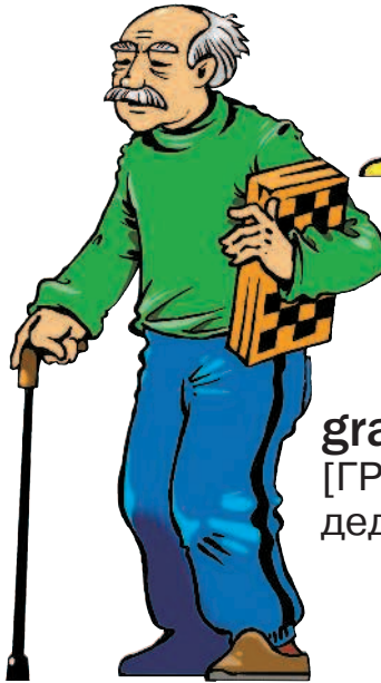
grandfather [ГРЭНФА:ЗЭ] дедушка