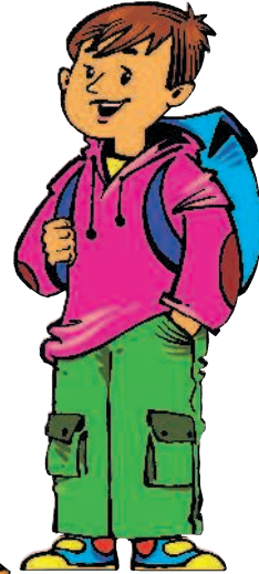
brother [БРАЗЭ] брат