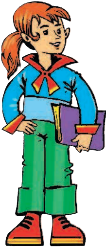
sister [СИСТЭ] сестра