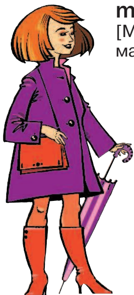
mother [МАЗЭ] мать