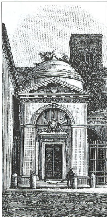
Гробница Данте в Равенне

Таким образом, в этом произведении собраны разнообразнейшие мотивы: наука, религия, политика, история Италии, автобиография автора, и в то же самое время она является подробнейшей энциклопедией Средних веков.