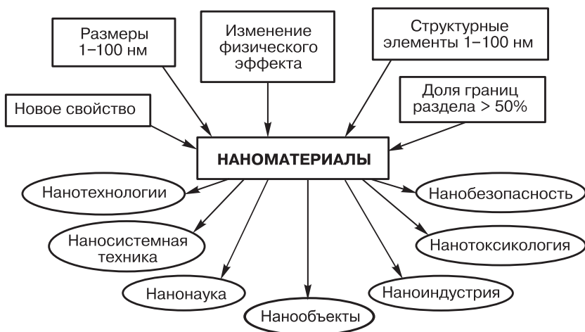
Рис. 1.1. Некоторые отличительные свойства наноматериалов и области их применения

За последние 10 лет только в России было проведено большое количество конференций, на которых особое внимание уделялось классификации и терминологии в области изучения и применения малоразмерных объектов (рис. 1.1). Если к этому вопросу подходить системно, то в определении необходимо отразить основные характерные свойства объекта или явления. В качестве таковых, на-