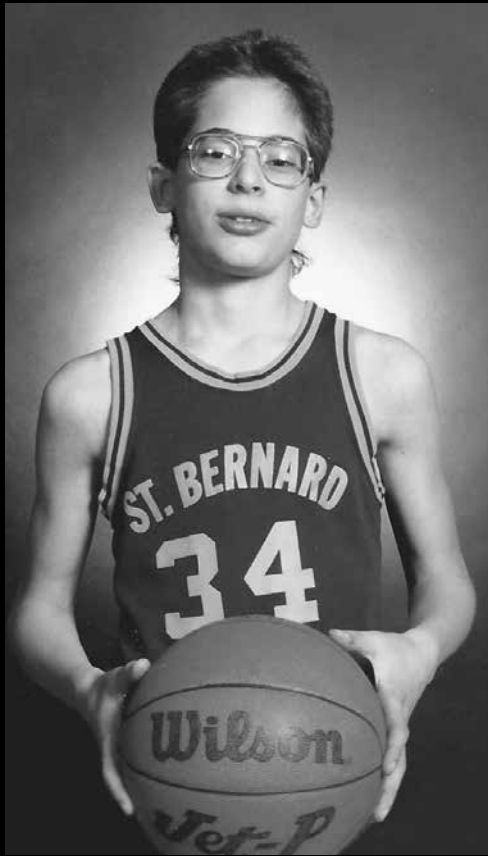
Это я раньше