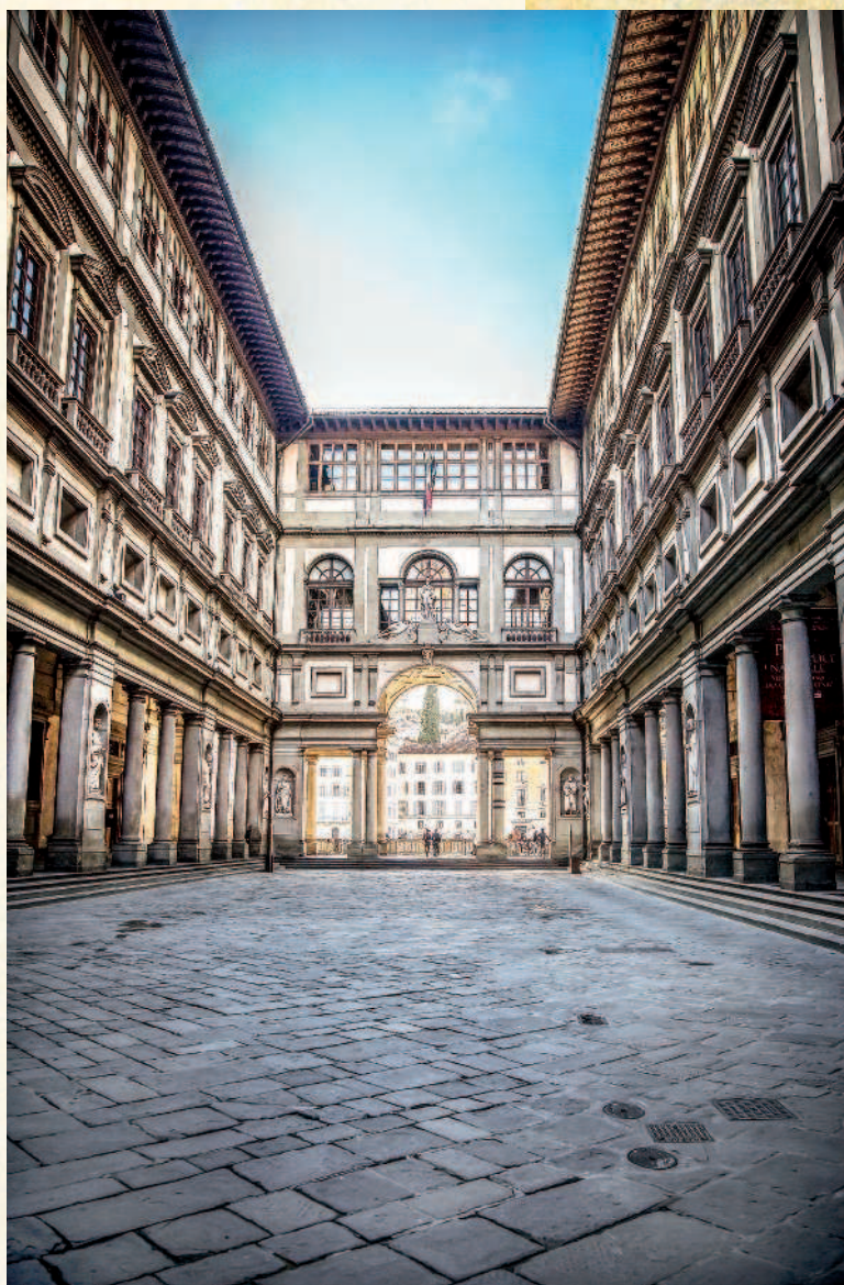
Галерея Уффици. Внутренний двор