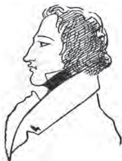
Портрет Владимира Ленского. Рисунок А. С. Пушкина

Хорошо, что роман все-таки был закончен. Но работа над «Евгением Онегиным» изрядно растянулась во времени. Начал ее Пушкин в Кишиневе в 1823 году, а закончил роман в Болдино в 1830 году. 25 сентября Пушкин дописал IX главу (потом сделавшуюся восьмой), но на этом дело не остановилось. Поэт начал десятую главу, которую не закончил. Текст прочи-