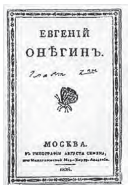
Титульный лист первого издания

Однако поэт предлагает нам не только искусно сочиненную фабулу. Он проявляет себя мудрым собеседником. Зачастую автор оставляет персонажей за кулисами, сам выходит на сцену и разговаривает с читателем напрямую, размышляя о сущности быстротекущей жизни.