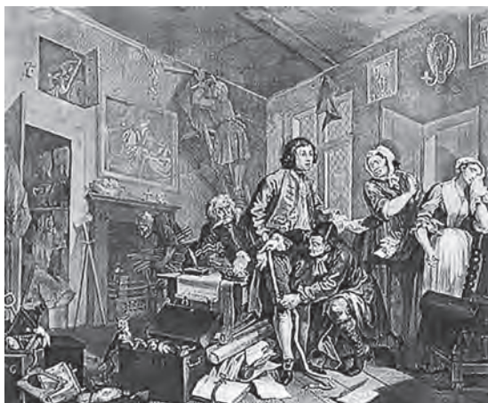
У. Хогарт. «Наследник», из цикла «Похождения Повесы»

Намек на ссылку. Пушкина выслали из Петербурга весной 1820 г. Он уехал из столицы меньше чем через полгода после Онегина, своего доброго приятеля.