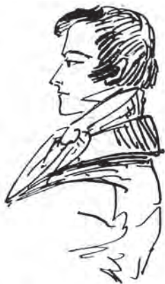
Портрет Евгения Онегина. Рисунок А. С. Пушкина.