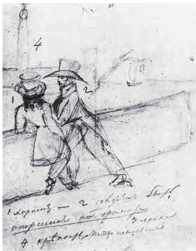
А. С. Пушкин. Автопортрет с Онегиным