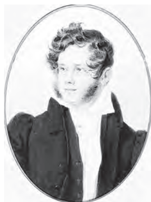
П. А. Вяземский

Цитата из стихотворения князя Петра Вяземского «Первый снег». «По жизни так скользит горячность молодая, // И жить торопится, и чувствовать спешит!» Петр Андреевич Вяземский (1792–1878) — старший друг Пушкина, тот сделал его одним из персонажей романа: в VII главе Вяземский беседует с Татьяной.