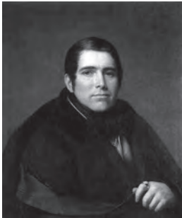
А. Тыранов. Портрет П. А. Плетнева

«Хотел бы я тебе представить...» Посвящение обращено к Петру Александровичу Плетневу (1791–1865), литератору, профессору, ректору Петербургского университета, давнему и близкому другу Пушкина, издававшему его книги.