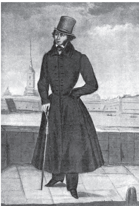
А. С. Пушкин. Портрет Горюнова