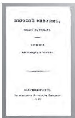
Титульный лист издания (1833 г.)

Первое полное издание романа появилось в 1833 году. Второе — последнее прижизненное — в январе 1837 года.