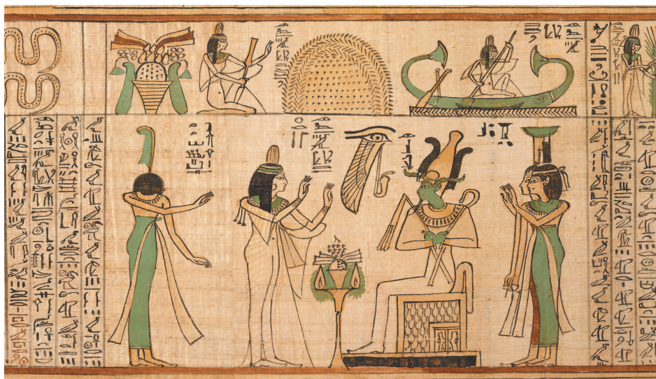
Погребальный папирус Нани, невицы Амона. XI в. до н. э.

Именно из Древнего Египта выводил историю Таро один из самых известных оккультистов XVIII века Антуан Кур де Жебелен.