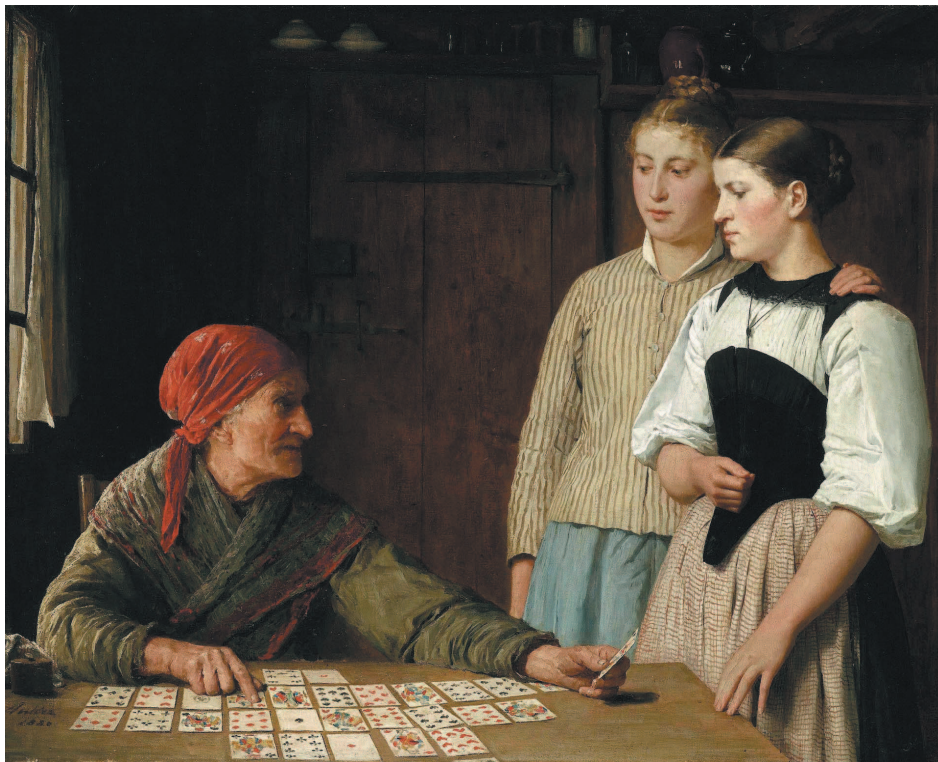
А. Анкер. Предсказание будущего. 1880 г.

дователей, именно французы делают игральные колоды такими, какими мы привыкли их видеть сейчас: появляются две черные и две красные масти. Причем есть версия, что мечи трансформировались в пики, монеты — в бубны, палицы — в трефы, а кубки — в черви. Постепенно закрепились такие элементы колоды, как Туз, Король, Дама, Валет; числовые карты получили обозначения от 2 до 10. Были также карты без обозначения мастей — видимо, там имело значение только «старшинство». Джокеры, или Шуты, которые во многих играх могут заменять собой любую карту, скорее всего, появились в колодах достаточно поздно.