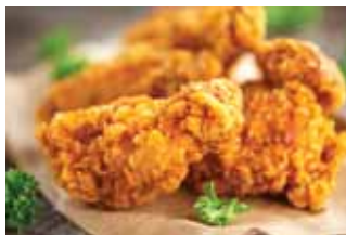
с жареной курицей