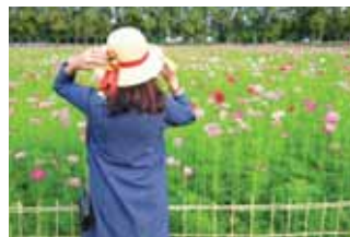
во время прогулки по саду