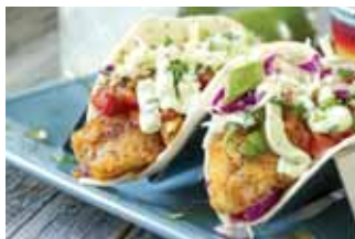
с рыбными тако