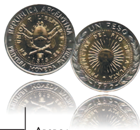
1 песо, 1995 г.

Аверс монеты — копия первых аргентинских монет 1813 г., на реверсе изображено «Майское солнце», символ Аргентины.