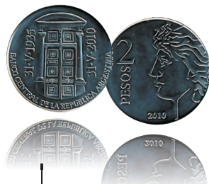
2 песо, 2010 г.

На аверсе монеты изображены двери в здании по адресу «ул. Реконкисты, 266». На реверсе — часть официального логотипа и номинал.