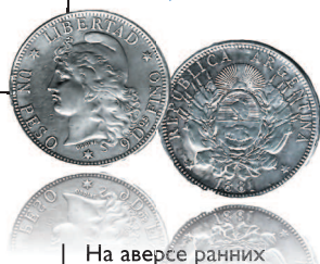
1 песо, 1881 г.

На аверсе ранних аргентинских монет чаще всего изображалась женщина во фригийском колпаке (символ свободы), на реверсе — герб или указание номинала.