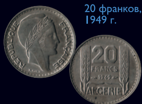
20 франков, 1949 г.

Портрет Марианны (типичный элемент оформления аверса французских монет — портрет женщины, символа Французской республики) на аверсе, номинал и год чеканки на реверсе.