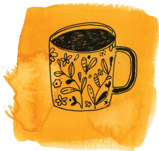
Рисунок на сильно увлажненном листе бумаги, выполненный обычной ручкой с черными чернилами.