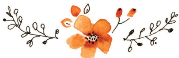
Рисунок внутри венка

Я постоянно использую венки, чтобы рисунок выглядел интереснее, а его композиция — гармоничнее. Они могут использоваться для того, чтобы выделить то, что вы считаете наиболее важным в рисунке.