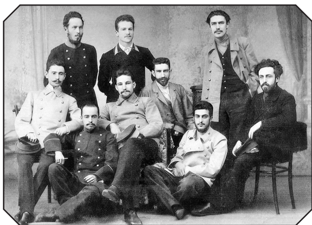
Студенты в форме

щей, у ст рьёвщиков н Сух ревке или у Ильинских ворот 1 . У Ильинских ворот есть д же две л вки специ льно студенческих ст рых костюмов. Тут не приходится р ссужд ть, приятно или неприятно носить пл тье неизвестно с чьего плеч , — быть может, больного или умершего от з р зной болезни.