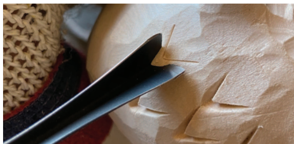
Угловая стамеска или стамеска-уголок