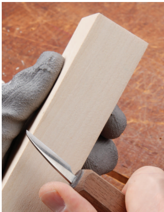
Липа: мягкая и легкая, с плотной текстурой.

Липа — моя любимая древесина для резьбы по дереву, так как она мягкая и легкая, с плотной, однородной и умеренной волокнистостью. Некоторые