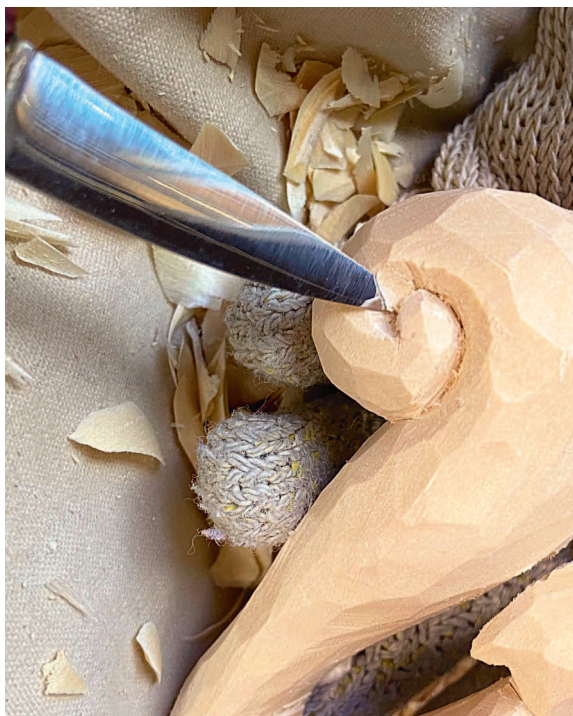
Классический резчицкий нож с лезвием длиной 2,5–3,8 см хорошо подойдет для проектов, описанных в этой книге.

и размеров, а также из разных материалов. Но здесь наиболее важно то, как инструмент ложится в руку и как ощущается в ней. Нож в буквальном смысле является продолжением вашей руки, и, если его неудобно держать и у вас нет полного контроля над ним, вы создаете себе неудобство еще до того, как начнете резьбу.