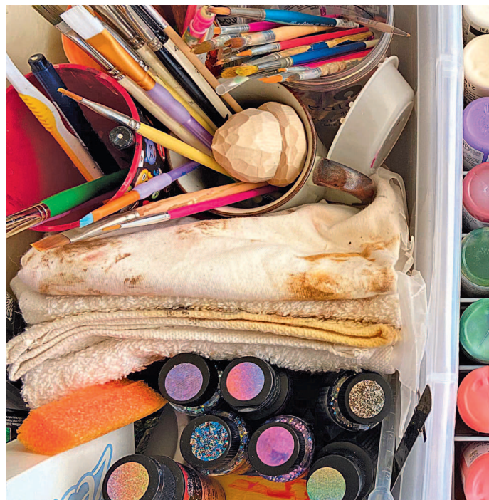
Я использую акриловые краски из местного магазина для рукоделия.

Я предпочитаю акриловые краски и не использую акварель или масло. Я люблю процесс росписи не меньше, чем саму резьбу, и с удовольствием экспериментирую с акриловыми красками, чтобы получить различные эффекты — далее