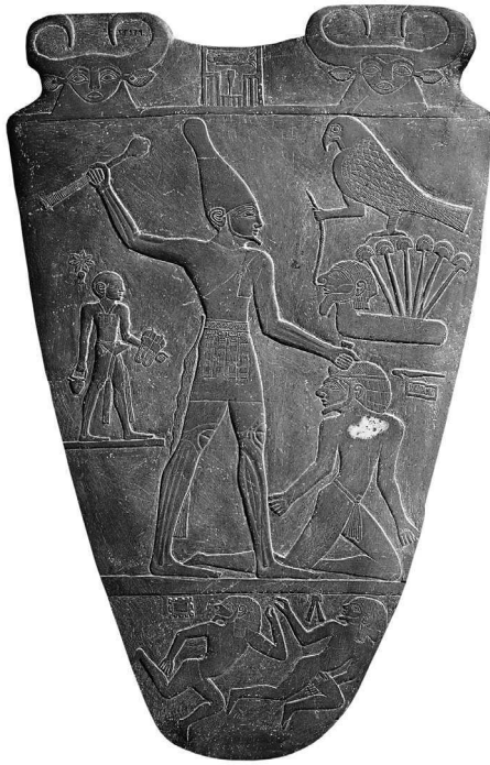
Палетка Нармера. Каменная пластина для ритуального растирания красок с изображением побед фараона. Ок. XXXII в. до н. э.

государства мы все помним по школьному курсу истории, не правда ли? Это появление органов власти, налогообложения, законов, профессиональных воинов и бюрократического аппарата. Это, конечно, не все, но нам пока хватит. В Египте развивается земледелие, скотоводство, системы орошения (египтяне рано научились использовать в своих целях регулярные разливы Нила). Этот период завершается объединением государства, которое приписывают фараону Нармеру.