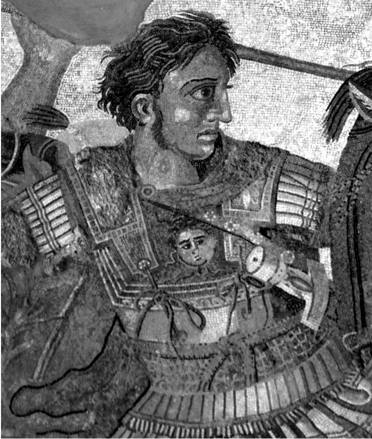
Александр Македонский. Римская мозаика из Помпеев. Ок. 100 г. до н. э.