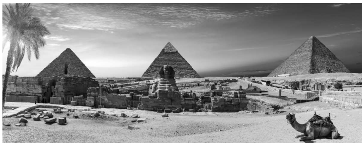
Вид на пирамиды Гизы. Современное фото

В любом крупном музее мы видим сотни картин на темы мифологии Древней Греции или Рима. А много ли перед нами предстанет полотен, иллюстрирующих, например, сказания древних египтян о создании мира или о воскрешении Осириса? В общем, с пиаром древним египтянам тоже не очень повезло... Впрочем, это можно объяснить все тем же недостатком информации.