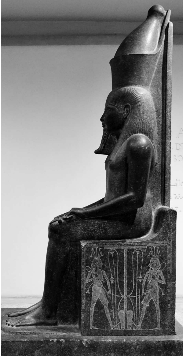
Скульптура Агума. Ок. XVI–XIII вв. до н. э.