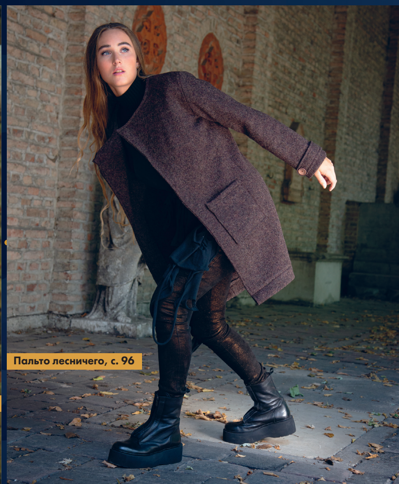
Пальто лесничего, с. 96