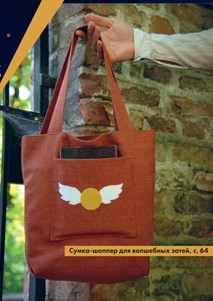
Сумка-шоппер для волшебных затей, с. 64