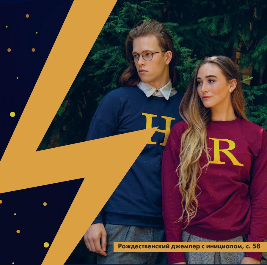
Рождественский джемпер с инициалом, с. 58