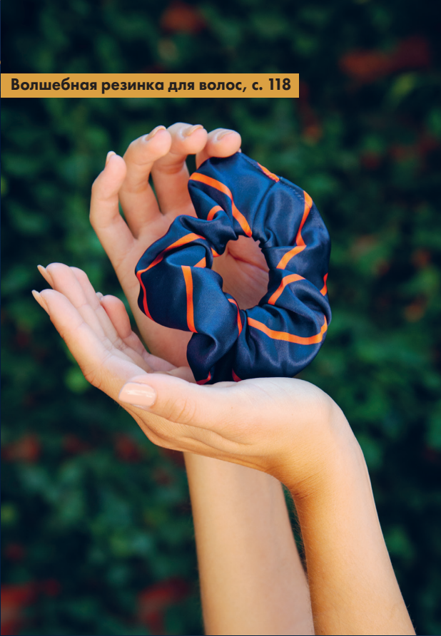
Волшебная резинка для волос, с. 118