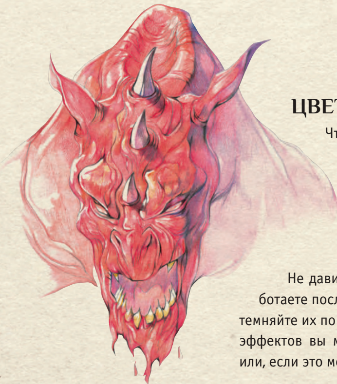
Дьявол, нарисованный цветными карандашами

Не давите на карандаш слишком сильно! Если вы работаете послойно, всегда начинайте со светлых тонов и затемняйте их по ходу работы. Наконец, для создания красивых эффектов вы можете растушевать цвета бьюварной бумагой или, если это мелкие детали, ватной палочкой!