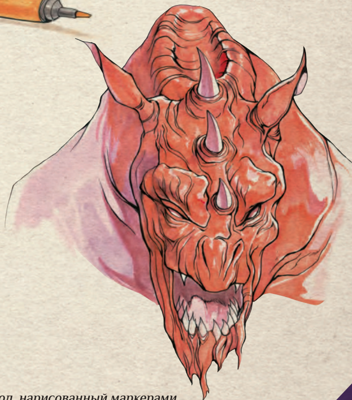
Дьявол, нарисованный маркерами

Будьте осторожны с маркерами... Они безжалостны!