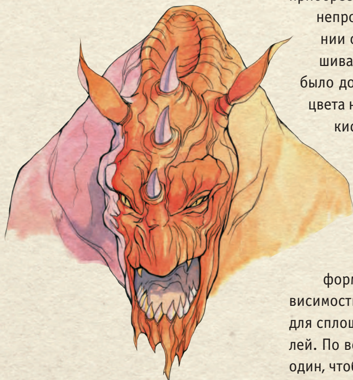
Дьявол, нарисованный гуашью

Гуашь должна быть маслянистой и однородной: именно это позволяет делать легкие штрихи на темном фоне (если он достаточно сухой). Используйте плотную или даже жесткую бумагу, чтобы лист не деформировался в процессе, и разные кисти в зависимости того, что вы хотите передать: плоские кисти для сплошных цветов, гибкие и тонкие кисти для деталей. По возможности всегда берите два стакана воды: один, чтобы намочить кисть, а другой чтобы помыть.