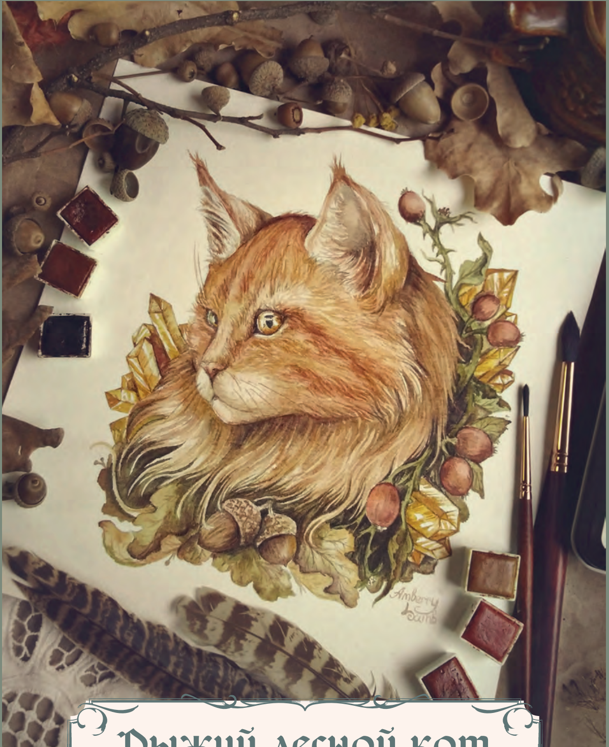
Рыжий лесной кот