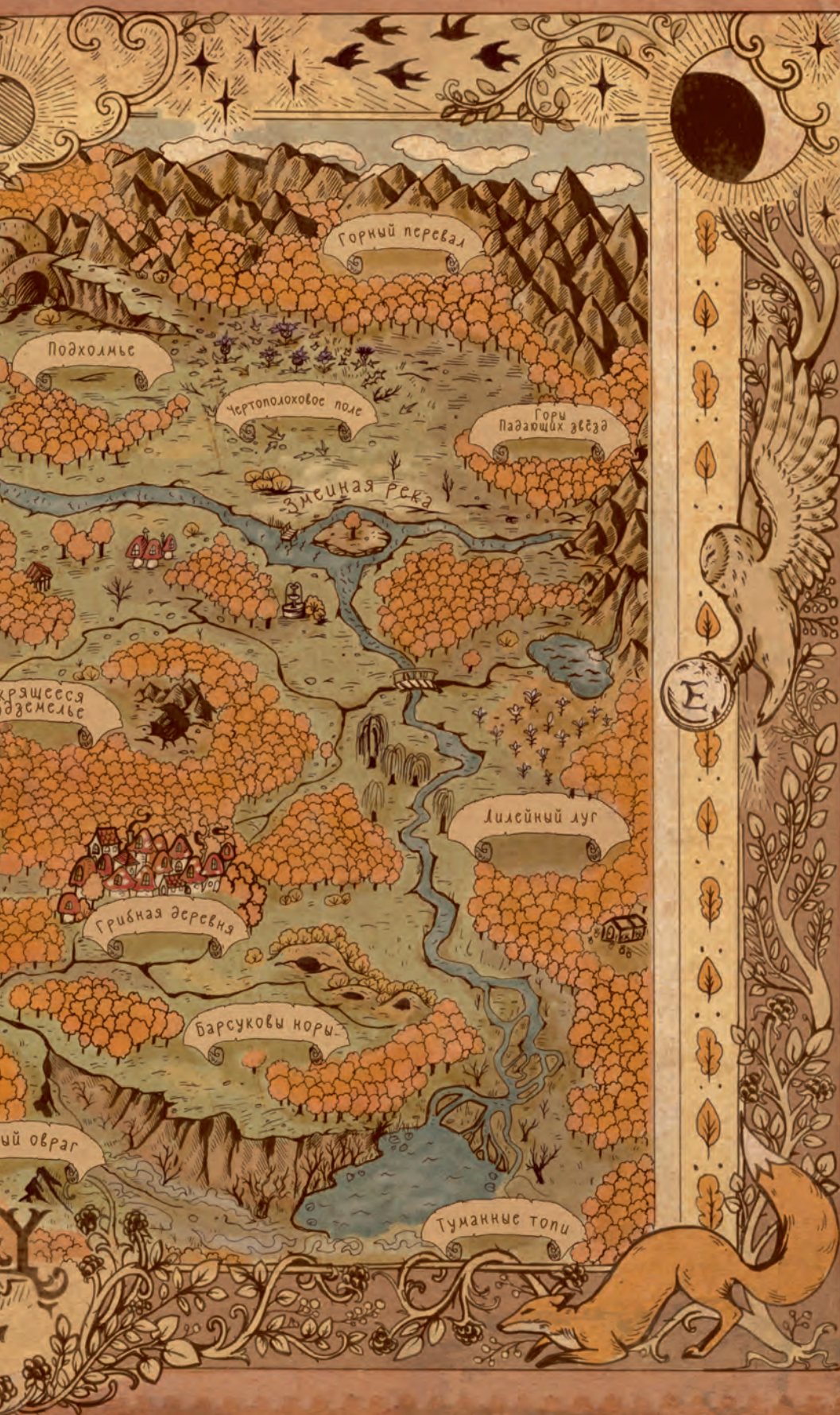
Карта Янтарного леса