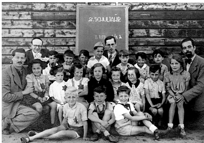
Класс еврейской школы, депортированный в Вестерборк

стояли хижины. Здесь ничто не могло напомнить мне город, который мы оставили. Там, где прошла моя юность, где я узнала счастье и свободу. Однако, когда я оглядываюсь назад и вспоминаю, что было со мной после той остановки в Вестерборке, я понимаю, что это было еще не худшее место.