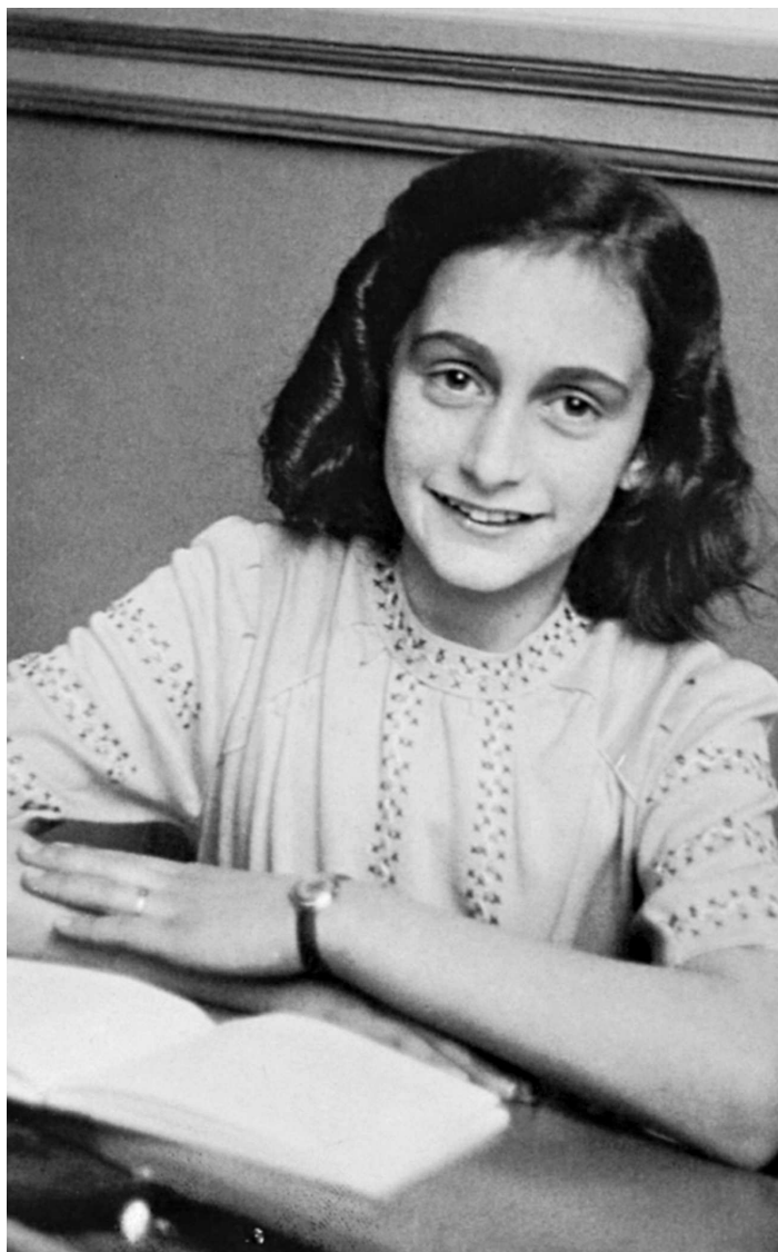
Анна Франк в школьном классе. Обе фотографии были сделаны в то время, когда они вместе ходили в школу. Декабрь 1941 года