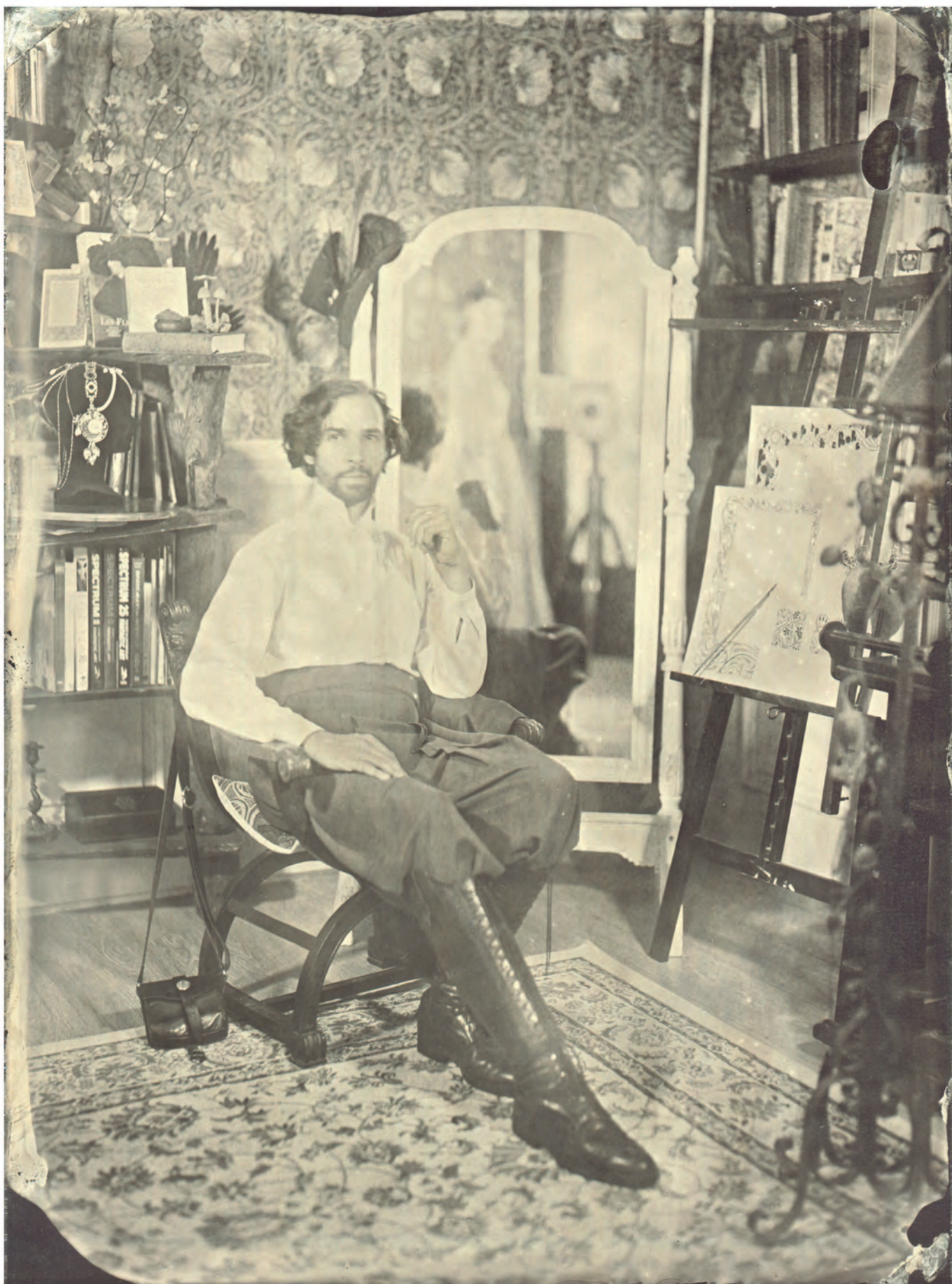
Портрет Йоанна Лоссея (амбротип).