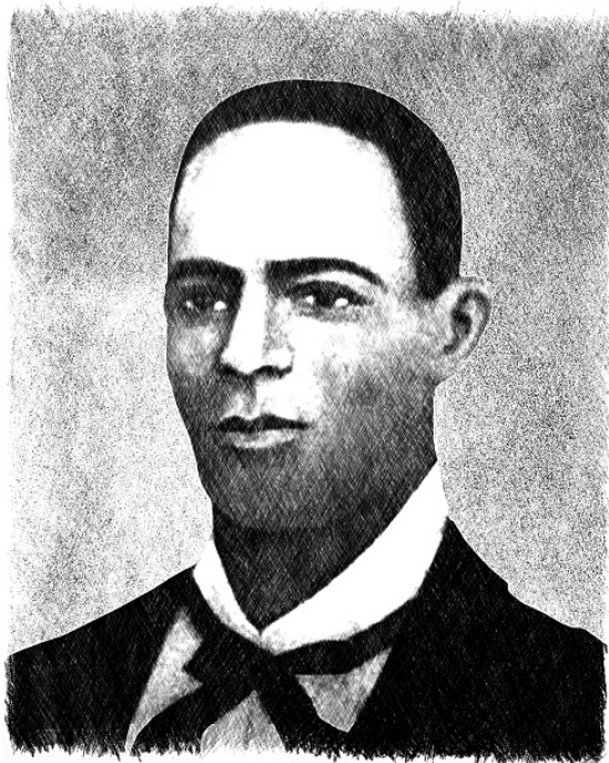
Andrés Facundo Cristo de los Dolores Petit

ту и Калабар. Именно оно дало толчок для распространения религии Пало Майомбе и Пало Кимбиса на Кубе. В тот исторический период Кимбиса преимущественно практиковалось на Гаити, а на Кубе было более распространено Пало Майомбе.