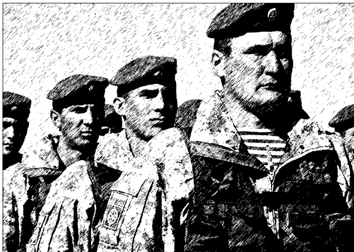
Краса и гордость Российской армии — ВДВ

ВДВ или воздушно-десантные войска — род войск в вооруженных силах страны, которые предназначены для боевых действий в тылу противника и его охвата в воздушном пространстве. Воздушно-десантные войска являются составной частью ВС практически всех крупных государств, состоят в подчинении командующего ВДВ. В их