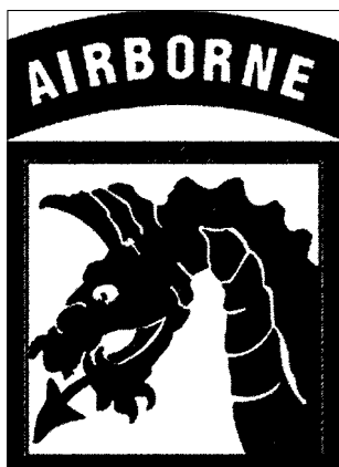
Эмблема американских ВДВ

войск, то американцы рассматривают свои ВДВ лишь как специальный компонент Сухопутных войск, практически просто как высококомобильную легкую пехоту. При действительно хорошей выучке ВДВ США — это скорее не элита вооруженных сил, а небольшая армия, предназначенная для переброски в кратчайшие сроки в любой регион мира. Организационно ВДВ США сведены в XVIII воздушно-десантный корпус, куда помимо парашютных и аэромобильных частей входят танки, мотопехота, армейская авиация, подраз-