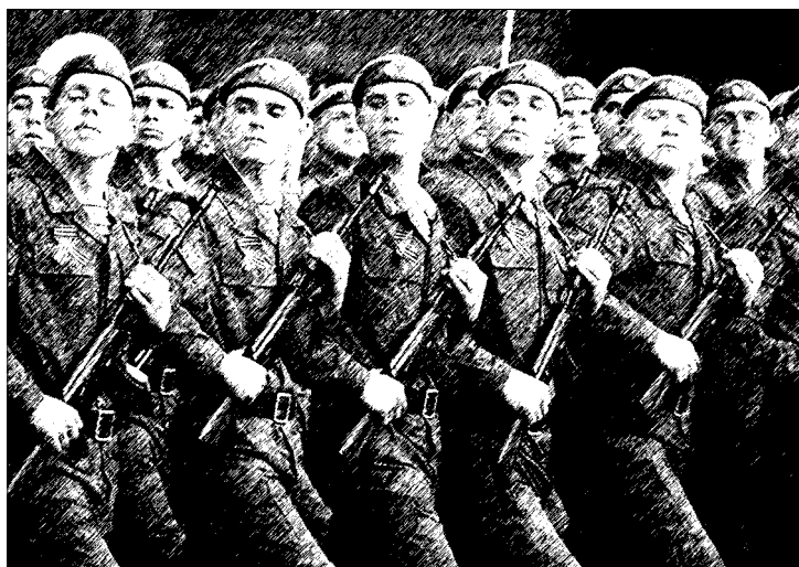
Десантники на параде