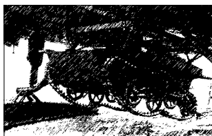
Подвеска танкетки под ДБ-3. 30-е гг. СССР

статочного количества боевой техники. Основное вооружение воздушно-десантных соединений и частей составляли преимущественно ручные и станковые пулеметы, 50-мм и 82-мм минометы, 45-мм противотанковые и 76-мм горные пушки, легкие танки (Т-40 и Т-38), огнеметы. Личный состав совер-