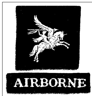
Эмблема английских ВДВ

Парашютный полк, учрежденный сэром Уинстоном Черчиллем в 1940 г., после завершения Второй мировой войны участвовал более чем в 50 кампаниях и заслуженно занимает достойное место среди самых престижных частей Британии. Насчитывавшая всего 370 человек, первая британская воздушно-десантная часть сложилась первоначально из личного состава 2-го отряда. Однако ряды ее быстро пополнялись добровольцами, и, оказавшись в Тунисе, парашютисты 2-й воздушно-десантной бригады, как стала именоваться часть с июля 1942 г., вскоре заслужили у немцев прозвище «die roten Teufel» — «красные дьяволы». В 1943 г. бригада десантировалась на Сицилии; позднее