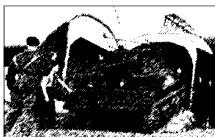
Погрузка легкого танка в десантный планер. Период Второй мировой войны

шал прыжки на парашютах типа ПД-6, а затем ПД-41. Малогабаритные грузы десантировались в парашютно-десантных мягких мешках. Тяжелая техника доставлялась десанту посадочным способом на специальных подвесках под фюзеляжами самолетов. Для десантирования использовались в основном бомбардировщики ТБ-3, ДБ-3 и пассажирский самолет ПС-84.