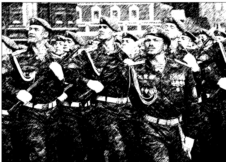
Десантники в парадном строю на Красной площади

«Стремясь к тому, чтобы наше Отечество никогда и никем не было бы унижено и чтобы имя русского всегда стояло «честно и грозно», мы должны пожелать, чтобы всегда у нас была сильная армия и чтобы граждане были проникнуты чувством патриотизма, а потому и любили свое войско, со всеми его достоинствами, которые неоспоримы, и со всеми его недостатками, которые исправимы».