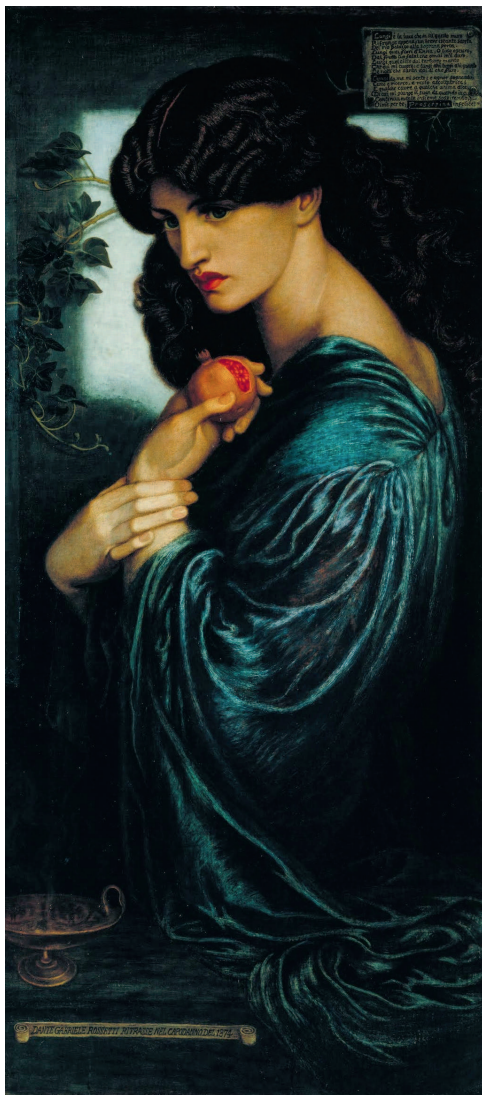
ДАНТЕ ГАБРИЭЛЬ РОССЕТТИ. ПРОЗЕРПИНА. 1874. ГАЛЕРЕЯ ТЕЙТ, ЛОНДОН

Считается, что все началось с того, что Афродита решила — хватит уже Персефоне ходить в девственницах. Несмотря на все вольности, общество тогда было, мягко говоря, консерватив-