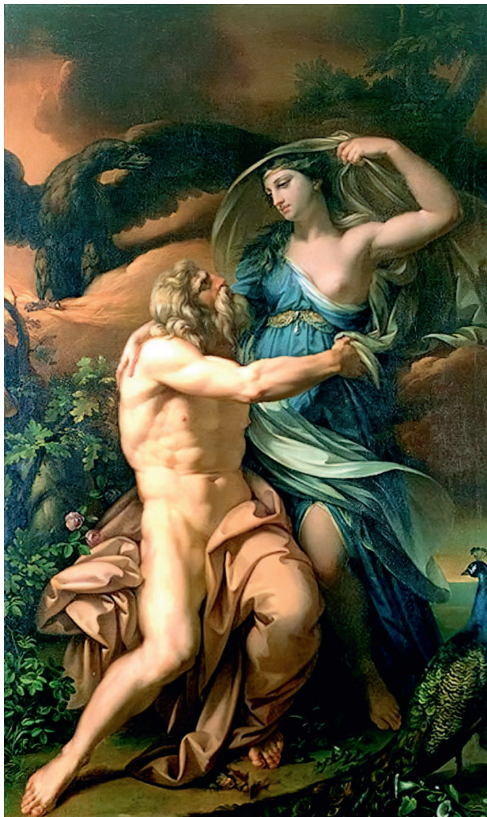
ГЭВИН ГАМИЛЬТОН, ЮНОНА И ЮПИТЕР. 1770. СОБРАНИЕ ГРАФА ЛЕСТЕРА, НОРФОЛК