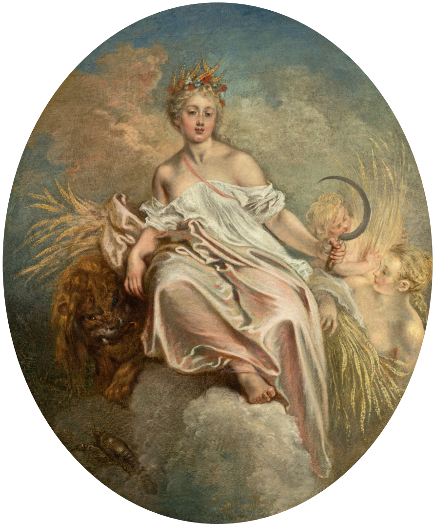
АНТУАН БАТТО. ЦЕРЕРА (ЛЕТО). ОКОЛО 1717/1718 Г. НАЦИОНАЛЬНАЯ ГАЛЕРЕЯ ИСКУССТВ, ВАШИНГТОН