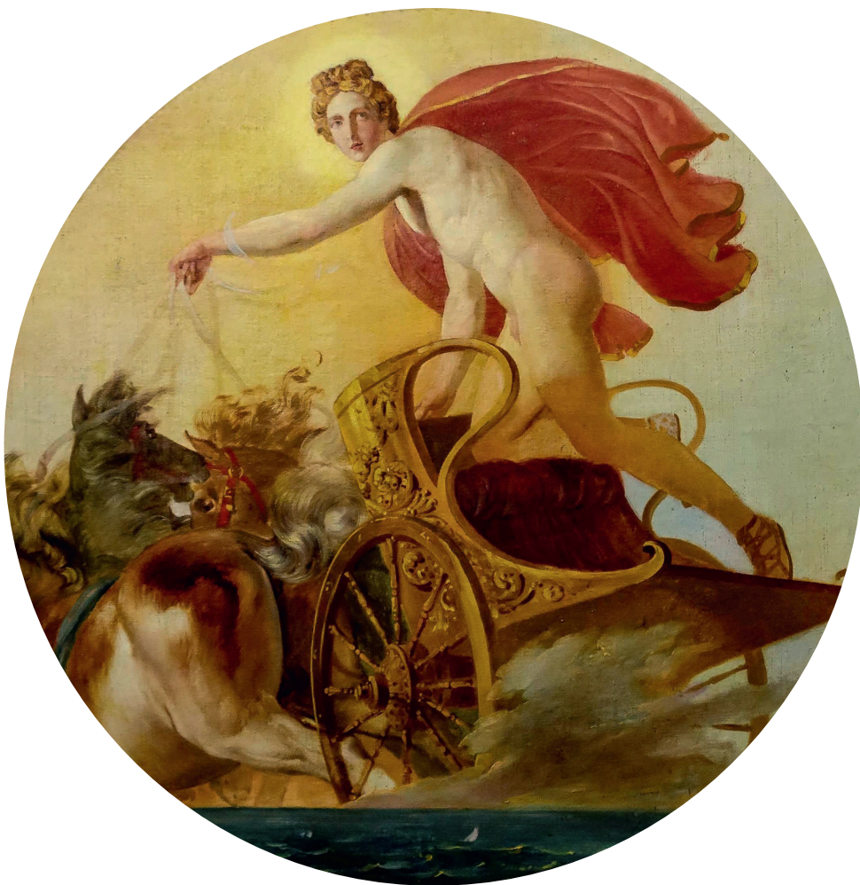
КАРЛ БРЮЛЛОВ. ФЕБ НА КОЛЕСНИЦЕ. 1846. ГОСУДАРСТВЕННЫЙ РУССКИЙ МУЗЕЙ, САНКТ-ПЕТЕРБУРГ