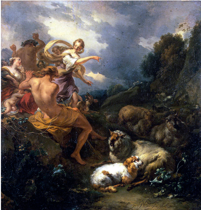
НИКОЛАС ПЕТЕРС БЕРХЕМ, ПАСТУШЕСКАЯ СЦЕНА («МЛАДЕНЕЦ ЮПИТЕР НА ОСТРОВЕ КРИТ»), ОК. 1680 Г. ЭРМИТАЖ, САНКТ-ПЕТЕРБУРГ

Повзрослевший Зевс, как и было предсказано ранее Кроносу, ринулся восстанавливать справедливость. Для начала он подговорил свою