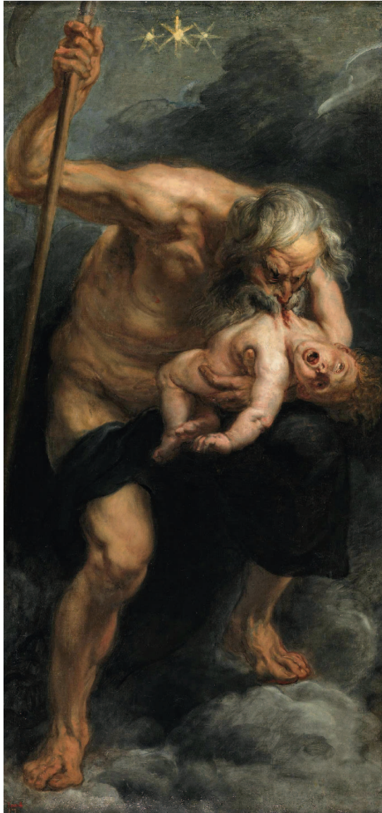
ПИТЕР ПАУЛЬ РУБЕНС. САТУРН, ПОЖИРАЮЩИЙ СВОЕГО СЫНА. 1636–1638 ГГ. МУЗЕЙ ПРАДО, МАДРИД