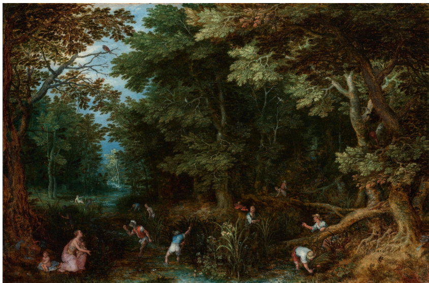
ЯН БРЕЙГЕЛЬ СТАРШИЙ. ЛАТОНА И ЛИКИЙСКИЕ КРЕСТЬЯНЕ (ДЕТАЛЬ). ОК. 1605. ГОСУДАРСТВЕННЫЙ МУЗЕЙ, АМСТЕРДАМ

Чтобы усложнить Лето жизнь, Гера решила задержать на Олимпе богиню Илифию, без которой никто на земле не рождался. Вот это уже выглядит плохо в биографии Геры. Если без Илифии никто не рождался, то, значит, страдала не только Лето. Никто не мог родить. А Гера удерживала Илифию, на секундочку, девять дней (запомните этот срок, позже пригодится). Как-то некрасиво вышло, Гера. Осуждаем.