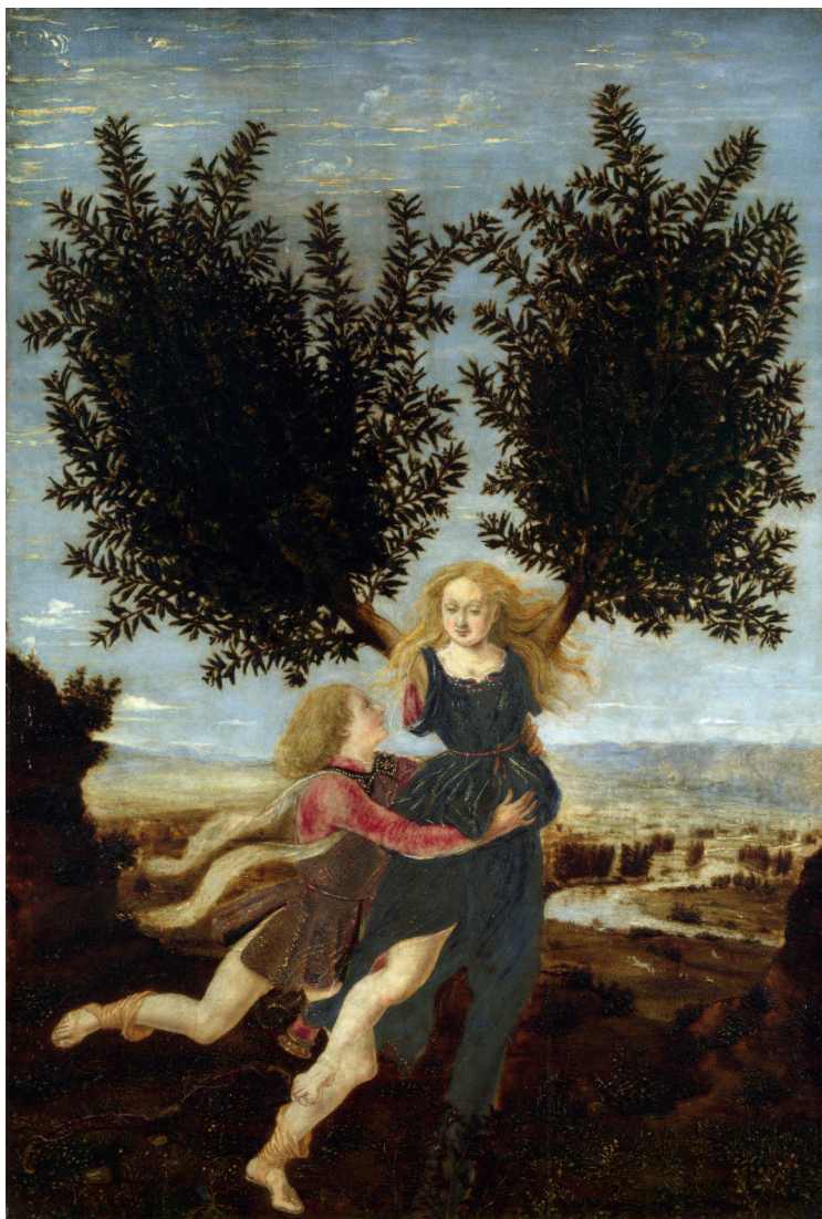
АНТОНИО ПОЛЛАЙОЛО. АПОЛЛОН И ДАФНА. ОК. 1479. НАЦИОНАЛЬНАЯ ГАЛЕРЕЯ, ЛОНДОН