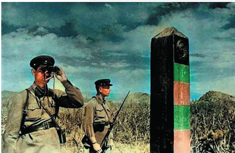
Советские воины-пограничники у пограничного знака

Прославленную песню военной поры впервые исполнил не в концертном варианте, а для записи на пластинку артист Петр Киричек в 1945 году.