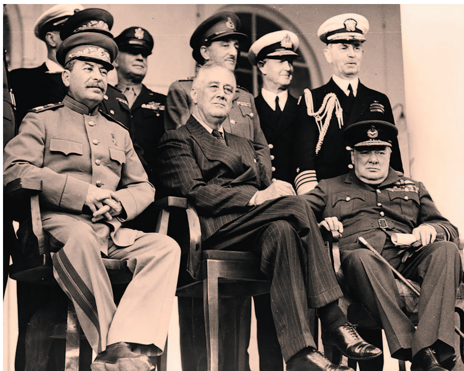
Фото «большой тройки» в Тегеране

А сразу после окончания церемонии вручения меча вожди «большой тройки» отправились фотографироваться на террасу, куда были принесены три кресла. Так была сделана историческая фотография Тегеранской конференции, обошедшая весь мир.