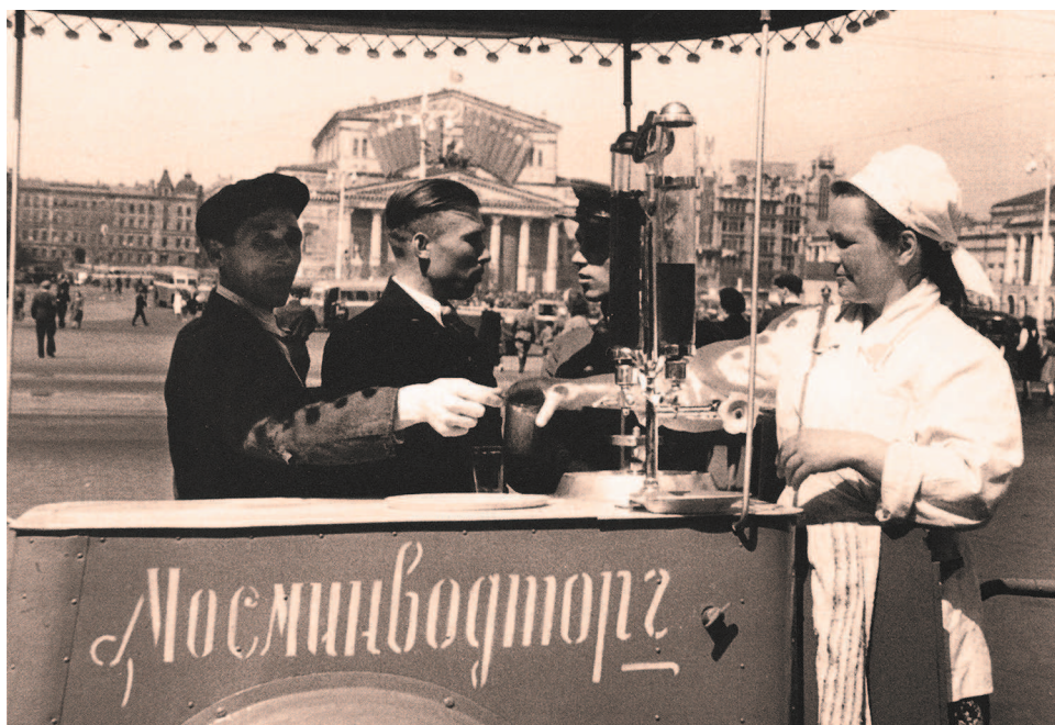
Продажа газированной воды. Москва, 1947 г.

Изобилие автоматов в нашей стране появилось во второй половине 1950-х годов. За рубежом были закуплены торговые автоматы Международного фестиваля молодежи и студентов в 1957 году. Через пару лет, изучив западные образцы и органично их усовершенствовав, в СССР стали производить отечественные торговые автоматы, которые размещались на людных улицах и площадях. Эти автоматы трудились с мая по сентябрь, а в остальное время простаивали под защитой металлических коробов. А уже через несколько лет «механические продавцы» появились и во многих советских кинокомедиях, ненавязчиво рекламируя технически подкованный советский сервис. Исчезли эти автоматы уже после распада СССР, а через несколько лет появились уже другие, более совершенные, но внешне похожие на старые советские автоматы.