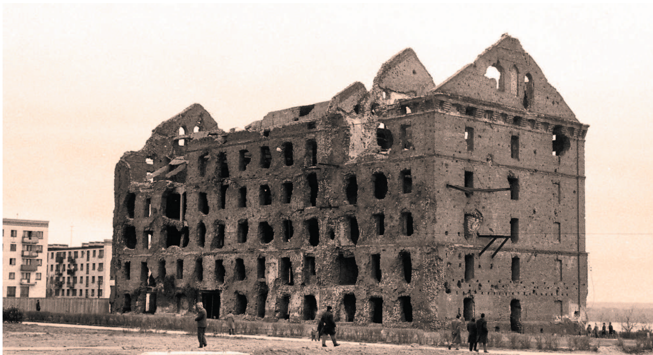
Руины Дома Павлова в Сталинграде

Гитлеровцы взбесились. Час от часу их огневые налеты становились все более ожесточенными. Несколько раз нам пришлось тушить пожары. Один тяжелый фугас залетел даже в подвал первого подъезда. Несмотря на ураганный огонь, наш дом стоял и разил врага свинцом и металлом».