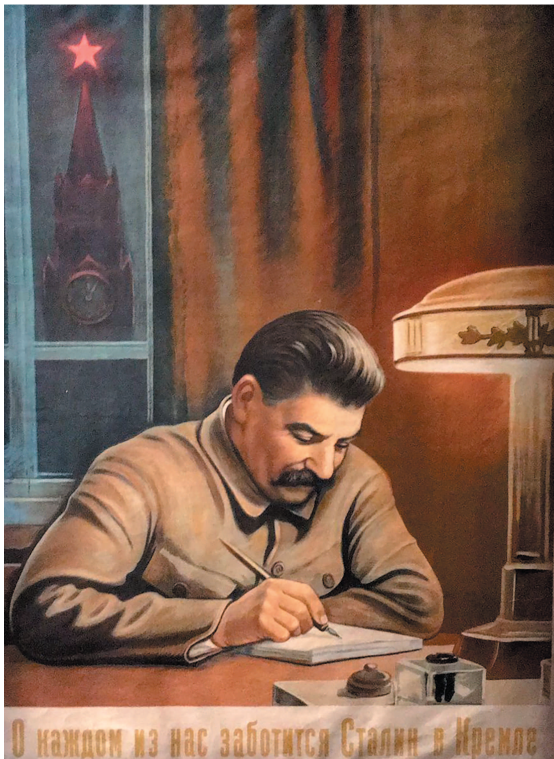
Плакат «О каждом из нас заботится Сталин в Кремле», художник Говорков В., 1940 г.