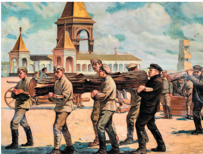
Советский агитационный плакат «Ленин на субботнике», художник Соколов М., СССР, 1929 г.

Правда, судя по мемуарам, бревно вместе с Лениным в тот день несли примерно 800 человек... Даже с учетом того, что работа шла несколько часов и бревно было не единственное, цифра впечатляет.