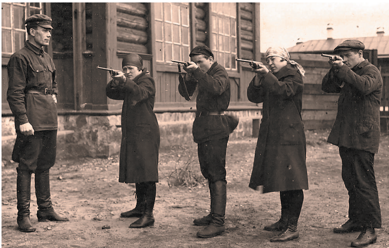
Стрелковая подготовка рабочих одной из фабрик

Свое название – «Ворошиловский стрелок» – значок получил в честь Климента Ворошилова, наркома по военным и морским делам, председателя Реввоенсовета СССР, будущего маршала и верного соратника Сталина.