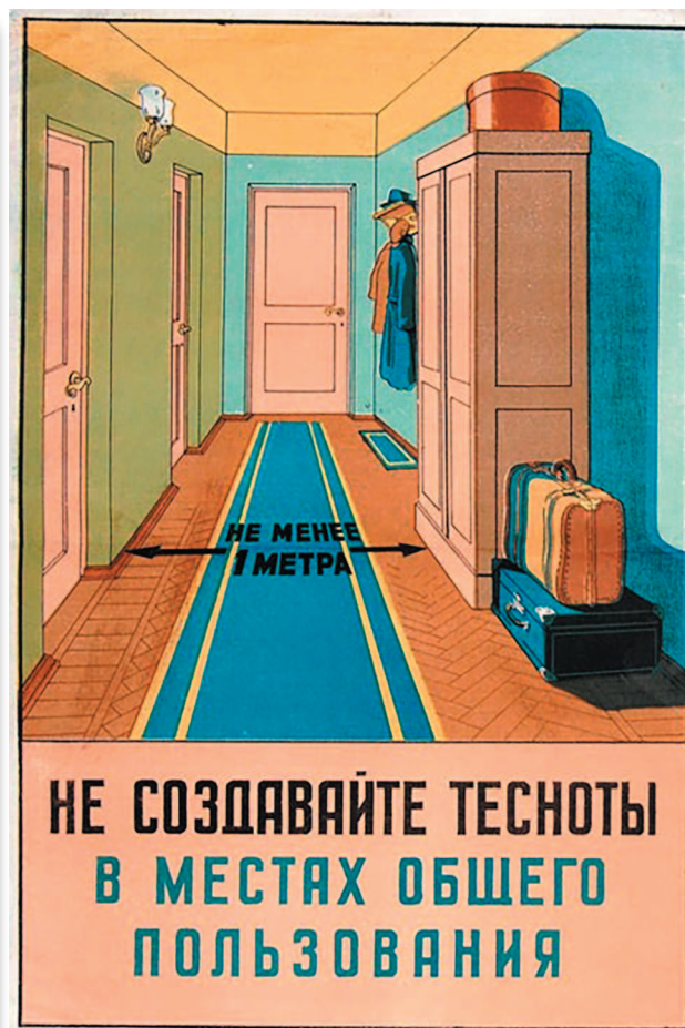
Агитплакат о коммунальной квартире