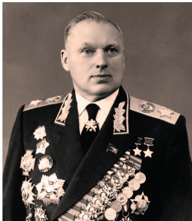
Маршал Советского Союза К. К. Рокоссовский с орденом Победы

Но и в этот раз вождь не обошелся без внесения правок: надлежало увеличить в размерах вписанное в круг в центре ордена изображение Спасской башни и части Кремлевской стены, наложив их на голубой эмалевый фон, а также уменьшить штралы (чеканные лучики) между концами пятиконечной звезды, составлявшей