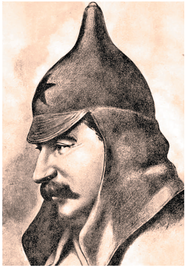
Иосиф Сталин в буденовке

Первым подразделением, организованно получившим новые головные уборы, стал отряд, сформированный из рабочих Иваново-Вознесенска и отправленный под командование Фрунзе на Восточный фронт. Отсюда и «фрунзенка». Бытовали и другие народные названия: «здравствуй и прощай» для летней полотняной буденовки, введенной в 1922 году, «громоотвод», «умоотвод». Известна рискованная шутка сере-