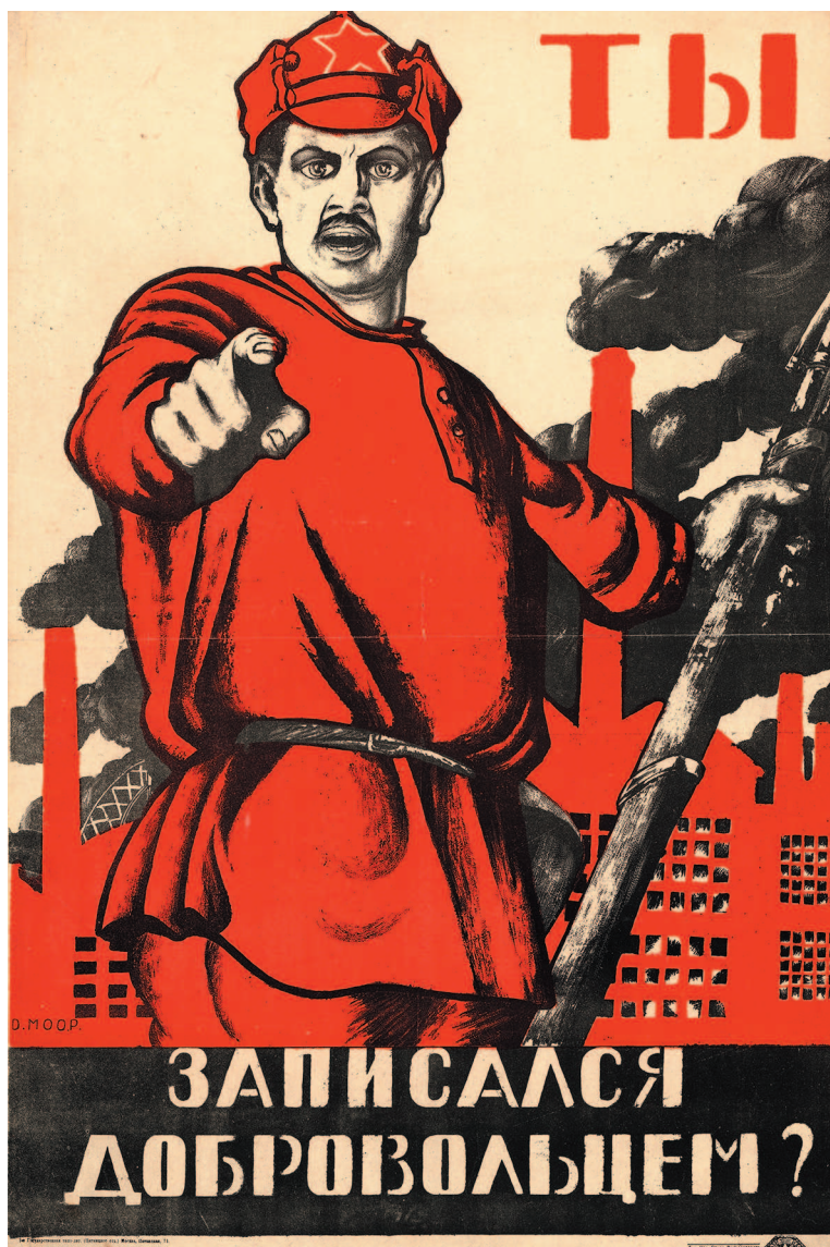
Советский агитационный плакат «Ты записался добровольцем?», художник Д. Моор, 1920 г.

Буденовка-фрунзенка стала одним из символов Гражданской войны и молодой Советской республики.