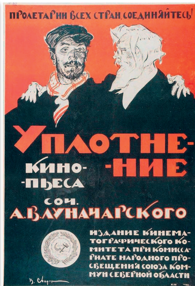
Афиша кинопьесы «Уплотнение»