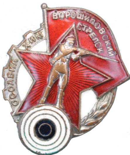
Значок «Ворошиловский стрелок»

Одним из самых массовых по числу награжденных знаком был год 1935-й, когда первую степень получили около миллиона (примерно 900 000) человек, а второй степени были удостоены 4706 человек. Всего в СССР было знаками «Ворошиловский стрелок» награждено несколько миллионов человек, но из них в разы меньше были награждены знаком «Ворошиловский стрелок» второй степени.