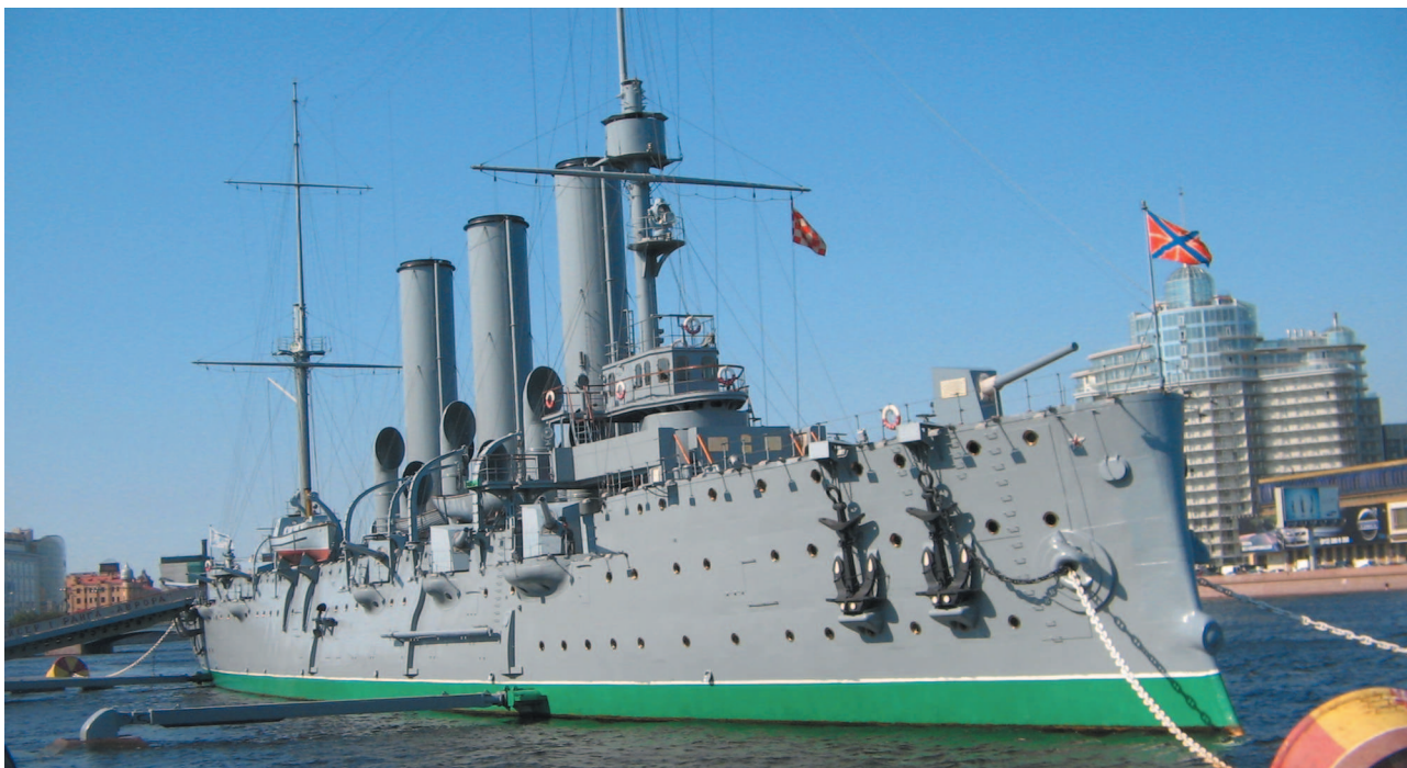
На вечной стоянке в Санкт-Петербурге

В 1965 году на «Ленфильме» был снят художественный фильм «Залп „Авроры“». Для него соорудили из дерева 4-метровую модель крейсера, причем одна из пушек была металлической, чтобы снять момент легендарного выстрела. Трубы маленькой «Авроры» дымили по-настоящему, а каждый иллюминатор подсвечивался миниатюрной лампочкой. Уникальная модель сохранилась до наших дней.