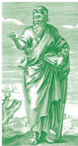
Пифагор, отец нумерологии

Пифагор, живший в V в. до н.э., изучал числа всю жизнь. Он был убежден, что числа обладают поистине магическими возможностями, и изобрел систему нумерологической классификации, которую мы используем и по сей день. В наши дни каждый школьник изучает фундаментальную для геометрии теорему Пифагора. Ученый считал, что