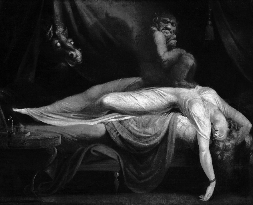
«Ночной кошмар» , Джон Генри Фюзели (1781)