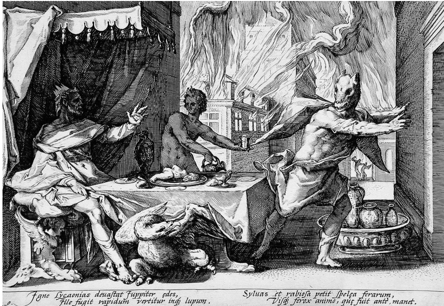
Ликаон превращается в волка, Хендрик Гольцинус (1589)