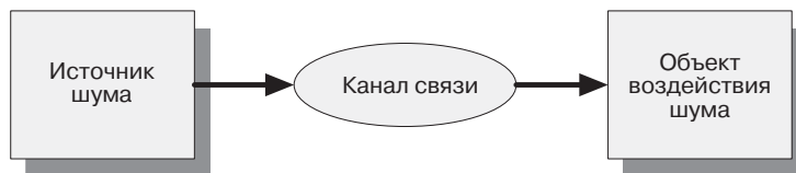
Рис. 1.2. Типичный путь прохождения шума

пей. Электромагнитное взаимодействие возникает, когда сигнальные тракты выступают в роли эффективных антенн, излучения которых создают помехи смежным цепям.