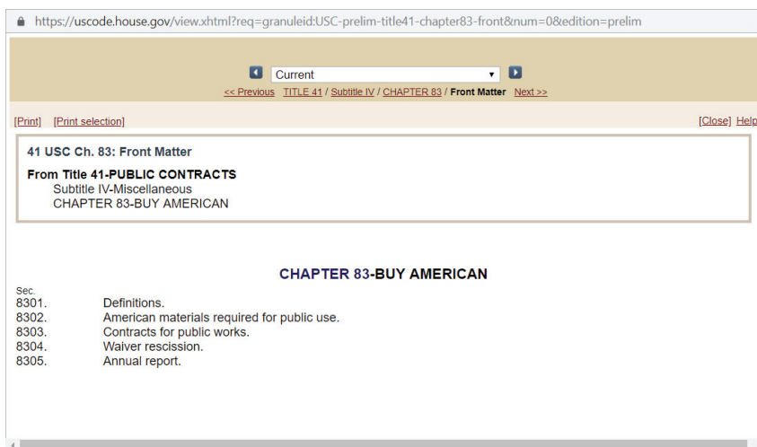
Рис. 2. Закон «Покупай американское» в Своде законов США

На рис. 2 продемонстрирована структура Закона «Покупай американское» на официальном сайте Свода законов США.