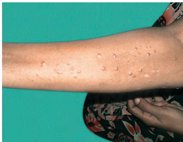
Рис. 1.6. Плоский лишай