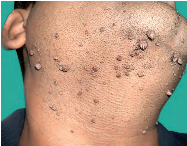
Рис. 1.7. Вирусные бородавки