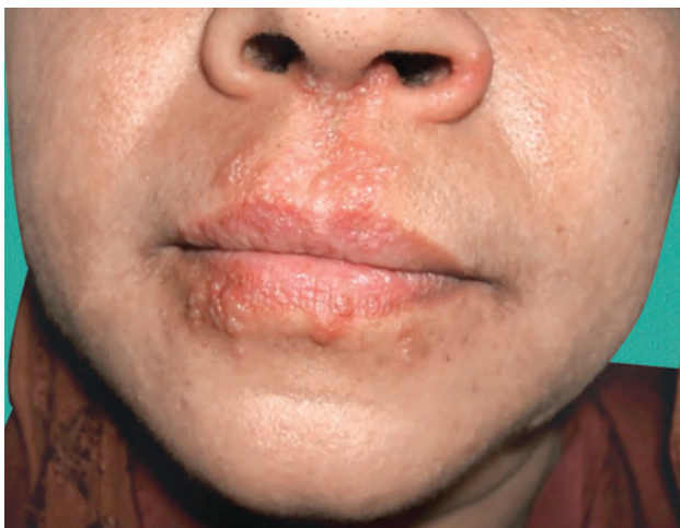
Рис. 1.15. Простой герпес

Везикула : округлый полостной элемент, содержащий жидкость, диаметром <1 см (рис. 1.15, 1.16).