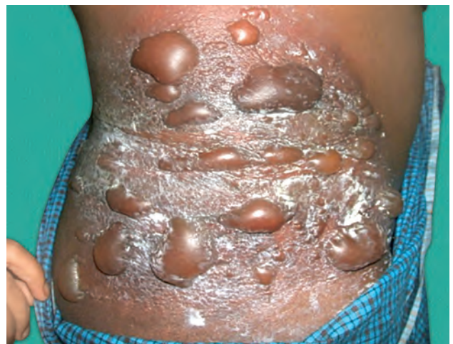
Рис. 1.18. Ожог