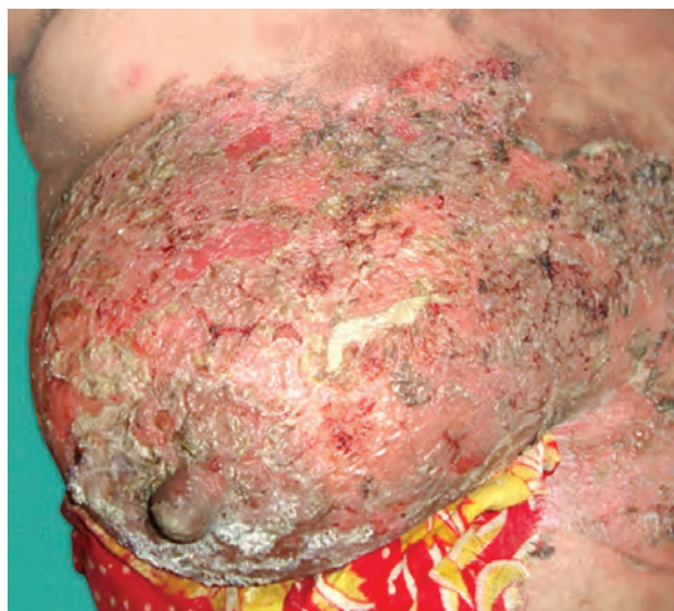
Рис. 1.22. Пузырчатка вульгарная

Корка : возникает при высыхании содержимого пузырьков, пузырей, гнойничков, может содержать засохшую сыворотку, гной, кровь и иногда бактериальные остатки. Когда корки отслаиваются, кожа под ними может быть сухой или красной и влажной (рис. 1.22, 1.23).