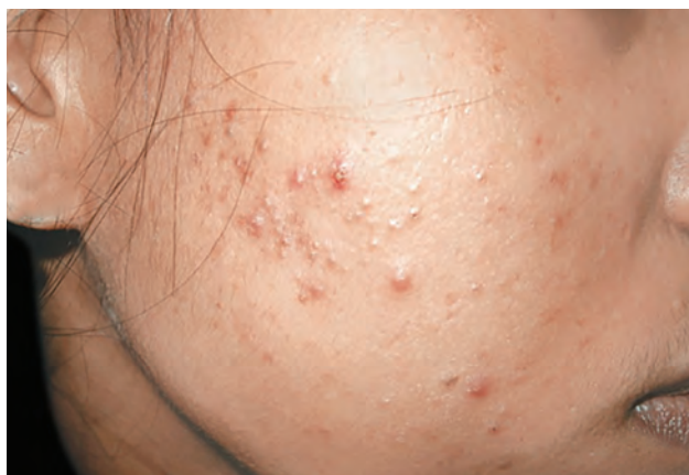
Рис. 1.20. Угревая сыпь

Волдырь : бесполомной округлый отечный элемент розоватого цвета различных размеров, отличающийся эфемерностью (существует от нескольких минут до нескольких часов) (рис. 1.21).