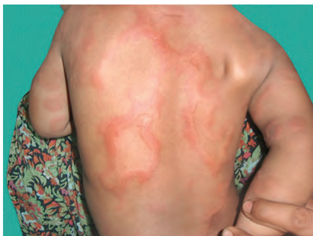
Рис. 1.21. Крапивница

Волдырь : бесполомной округлый отечный элемент розоватого цвета различных размеров, отличающийся эфемерностью (существует от нескольких минут до нескольких часов) (рис. 1.21).