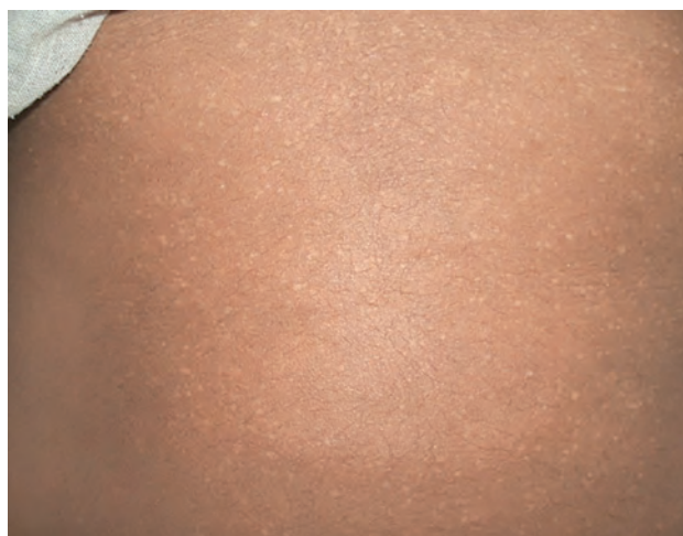
Рис. 1.2. Гипопигментация по типу «дождевых капель» при хроническом арсеникозе