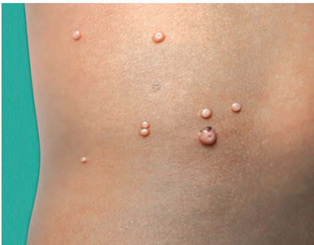
Рис. 1.8. Контагиозный моллюск

Узелок : бесполой инфильтративный, куполообразный с четко очерченными возвышениями, затрагивающими эпидермис, дерму. Могут распространяться на подкожную клетчатку. Диаметр >1 см, при пальпации вдавливаются, мягкие, эластичные или твердые (рис. 1.11–1.14).