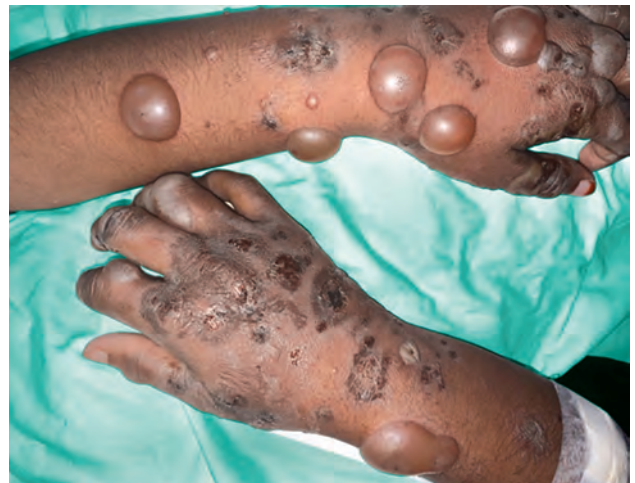
Рис. 1.17. Буллезный пемфигоид

Пузырь : полостной округлый элемент, содержащий жидкость (серозную, геморрагическую), диаметром >1 см (рис. 1.17, 1.18).