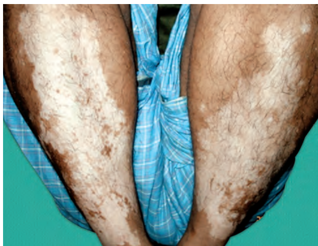
Рис. 1.4. Витилиго

Примечание редактора: российская классификация первичных элементов рассматривает пятно (лат. макула) как ограниченный участок кожи с измененной окраской при сохранении рельефа и консистенции кожи. Пятно находится на одном уровне с окружающей кожей и не определяется при пальпации. Границы пятна могут быть как четкими, так и размытыми; размеры пятна и его цвет могут быть любыми. Пятна бывают сосудистые, пигментные и искусственные (татуаж). Сосудистые пятна делятся на воспалительные и невоспалительные. Воспалительные пятна имеют розово-красную, иногда с синюшным оттенком окраску и при надавливании стеклом (витропрессия) бледнеют или исчезают, а при прекращении давления восстанавливают свою окраску. В зависимости от размеров сосудистые пятна