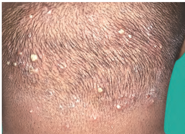
Рис. 1.19. Фурункул

Пустула : округлый элемент, содержащий гной (инфекционно-нейтрофильный или стерильный) диаметром <1 см (рис. 1.19, 1.20).