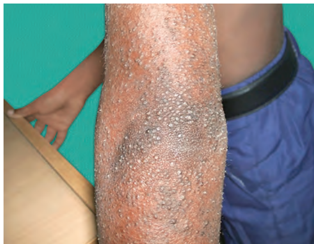
Рис. 1.5. Фолликулярный кератоз

Папула: поверхностный плотный бесполостной элемент, как правило, характеризующийся изменением окраски кожи, ее рельефа и консистенции. Размер варьирует от булавочной головки до 1 см (0,5–1 см) (рис. 1.5–1.8). По глубине залегания выделяют папулы эпидермальные, расположенные в пределах эпидермиса; дермальные, локализующиеся в сосочковом слое дермы, и эпидермодермальные. Папулы могут сливаться в бляшки, которые представляют собой ограниченные плотные возвышения эпидермиса диаметром >1 см. Могут располагаться по отдельности или сливаться (рис. 1.9, 1.10).