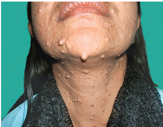
Рис. 1.14. Узелки при нейрофиброматозе

Везикула : округлый полостной элемент, содержащий жидкость, диаметром <1 см (рис. 1.15, 1.16).