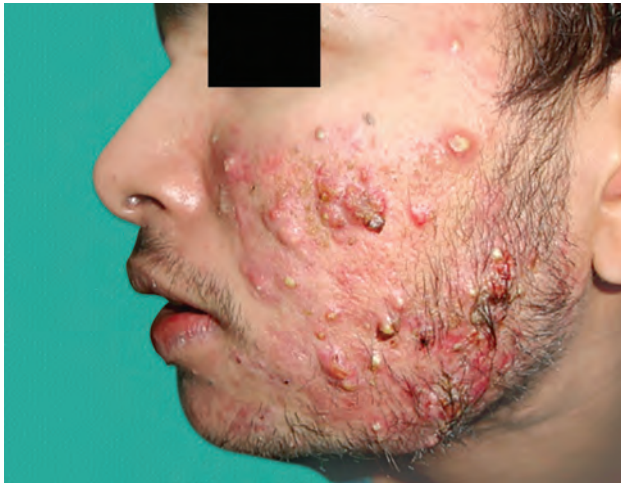
Рис. 1.13. Узловато-кистозные акне