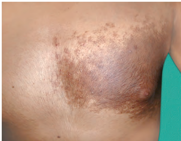
Рис. 1.3. Невус Беккера

Пятно: плоское локальное изменение цвета кожных покровов размером более 1 см (рис. 1.3, 1.4).