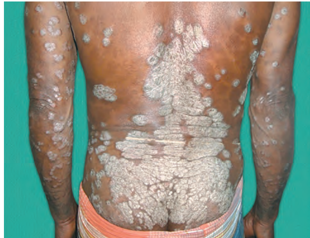
Рис. 1.10. Псориаз